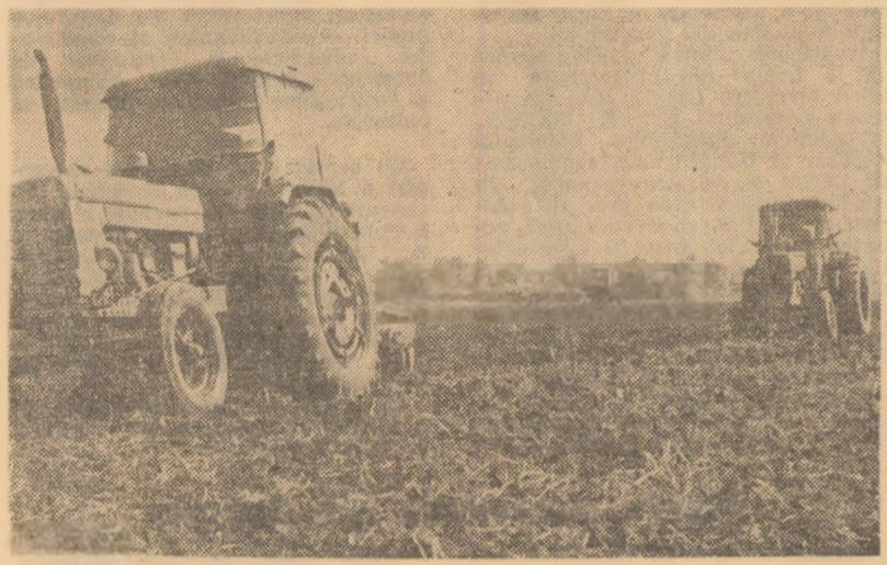
La C.A.P. Răcari, județul Dimbovița, timpul bun de lucru este folosit din plin la efectuarea araturilor