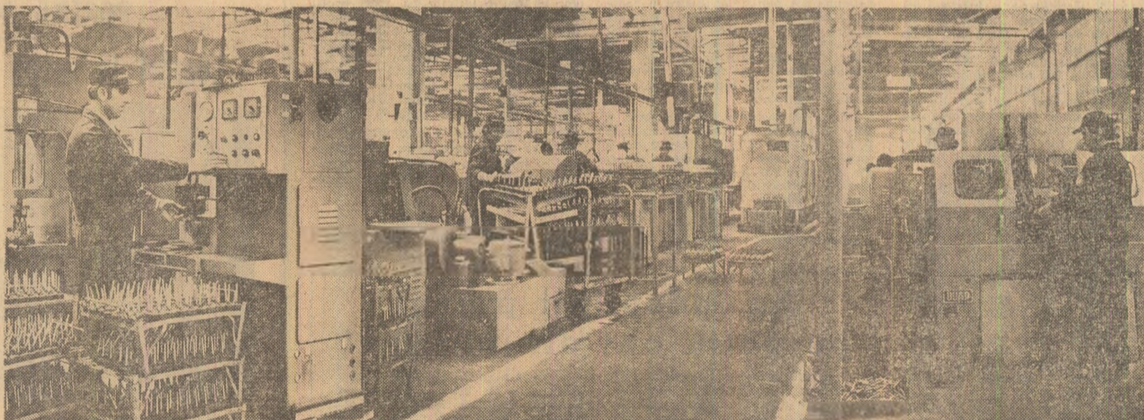
Într-una din secțiile întreprinderii de motoare electrice Pitești

Un eveniment deosebit pe platforma Combinatului siderurgic Galați: uzina coaso-chimică nr. 1 a produs 10 milioane tone de coals de la intrarea în funcțiune a celei dintîi baterii de coalsificare și pînă în prezent. Acum oamenii muncii din această uzină — care realizează 80 la sută din producția națională de coals — s-au angajat să producă zilnic, la fiecare baterie, cite un pilot de coals peste capacitățile de lucru. (Dan Pleșu).