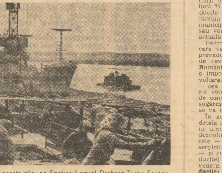
Aspect de muncă, din aceste zile, pe Santierul naval Drobeta-Turnu Severin

Din municipiul Petroșani aflăm că, în întîmpinarea marilor forum-uri a comunistilor, colectivele din unitățile industriale au realizat sarcinile de plan pe 4 ani ai actualului cincinal. Se apreciază că avansul de timp cîștigat permite obținerea unei producții industriale suplimentare, pînă la finele perioadei, în valoare de 628 milioane lei. La acest important succes o contribuție deosebită au adus oamenii muncii de la întreprinderile miniere Poroșeni și Petrița. Intreprinderea de preparare a cărbunelui Valea Jiului, Intreprinderea de utilaj minier Petroșani și Intreprinderea de fire artificiale „Viscoza” — Lupeni.