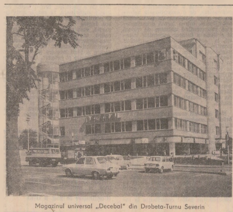
Magazinul universal „Decebal” din Drobeta-Turnu Severin

deri, institute și șantier, cit și în ce privește activitatea organizațiilor locale lor, în educarea politico-cetățenească a maselor etc. Iar aceste măsuri vor fi cu atît mai eficiente cu cît vor reuși să asigure participarea de fapt a milioane și milioane de oameni la înfăptuirea politicii partidului.