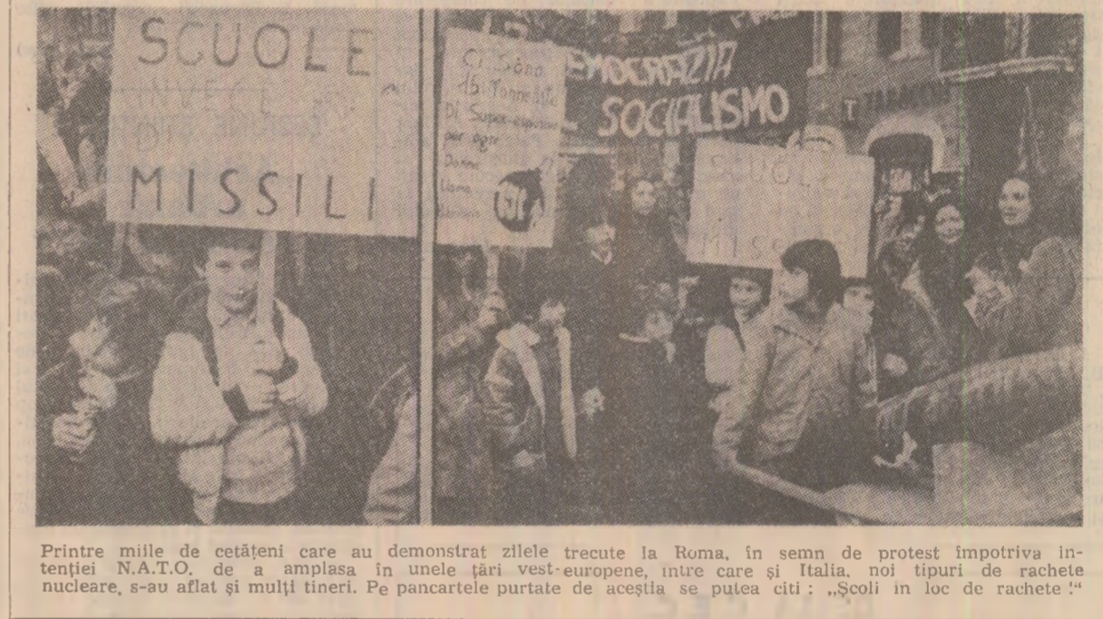
Printre mii de cetățeni care au demonstrat zilele trecute la Roma, în semn de protest împotriva intenției N.A.T.O. de a amplasa în unele țări vest-europene, între care și Italia, noi tipuri de rachete nucleare, s-au aflat și mulți tineri. Pe pancartele purtate de aceștia se putea citi: „Școli în loc de rachete!”