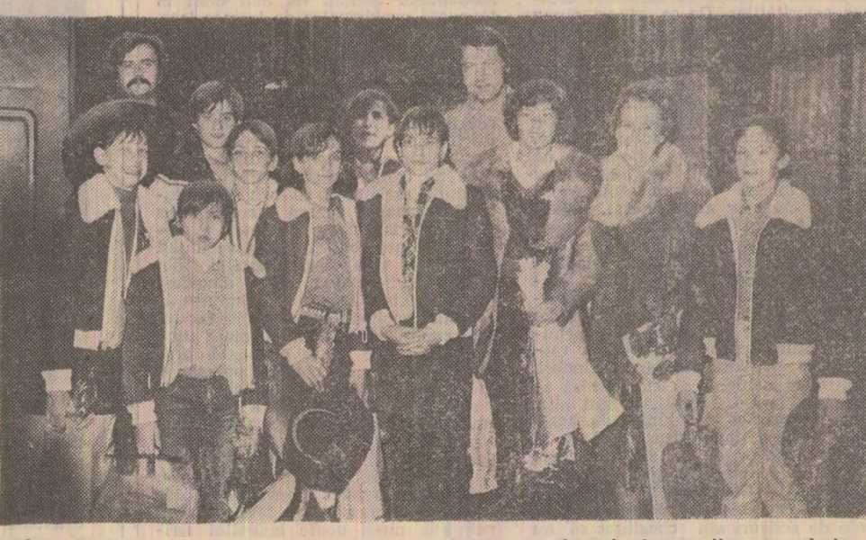
IN PAGINA A V-A : Relatarea sosirii gimnastelor și gimnastilor noștri de la campionatele mondiale

IERI, PE AEROPORTUL OTOPENI Aplauze și flori pentru strălucitele victorii ale gimnasticii românești la recentele campionate mondiale