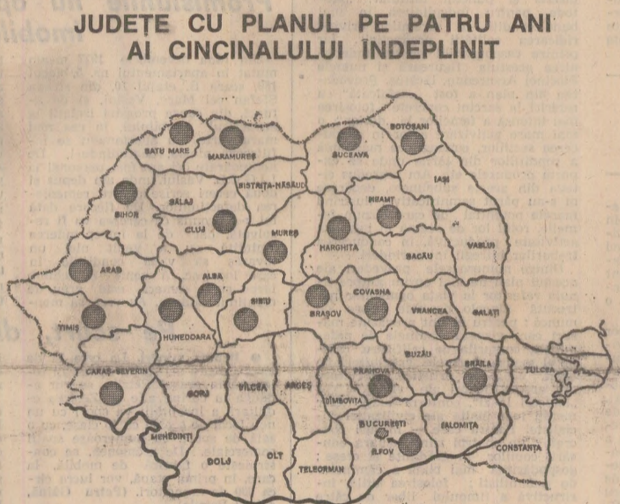
Pînă ieri, 17 decembrie 1979, un număr de 20 de județe și municipiul București (marcate pe hartă) au realizat planul pe patru ani ai cincinalului