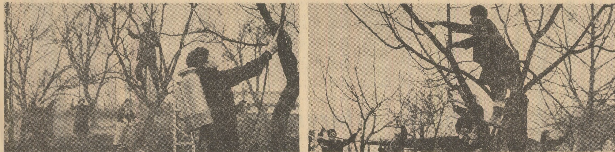
Lucrări de îngrijire a pomilor, executate ieri în livada I.P.I.L.F. Giurgiu, județul Ilfov