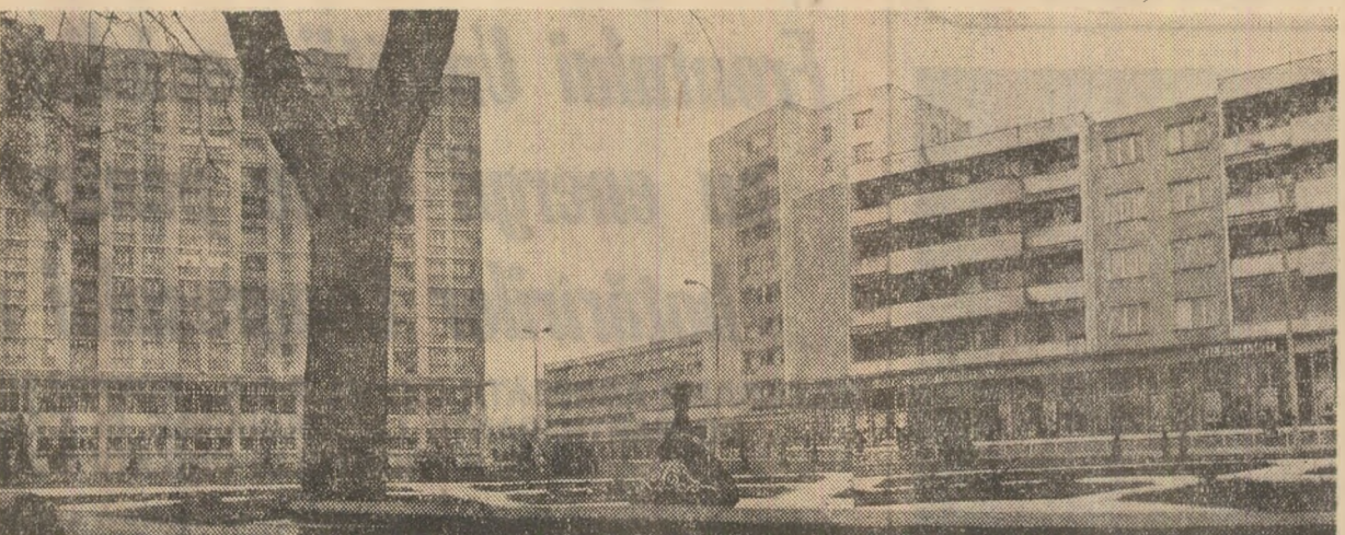
La Giurgiu blocuri noi, frumoase. Și altele ar fi putut arăta la fel dacă ritmul construcțiilor ar fi fost cel planificat...