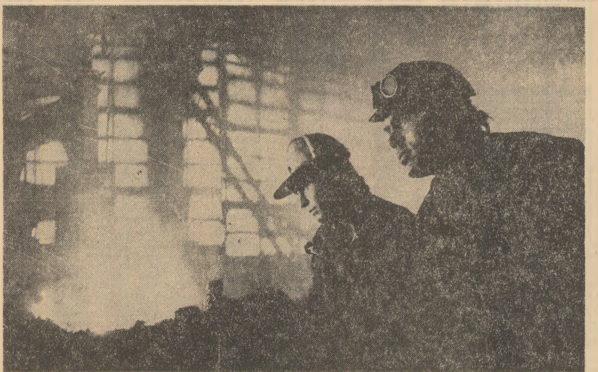
Combinatul siderurgic Galați: se elaborează o nouă șarjă de oțel

Colectivul combinatului este conștient că de străduințele proprii depinde în măsură hotărîtoare recuperarea restanțelor. Dar în fel de adevărat este și faptul că fără o maximă concentrare a forțelor constructorilor pentru finalizarea rapidă a investițiilor de pe platforma combinatului și fără un sprijin mai susținut din partea unităților colaboratoare, restanțele nu pot fi lichidate integral. Astfel, scurtarea duratei de elaborare a șarjelor presupune, printre altele, și o dozare corespunzătoare a fierului vechi; or, intrucît fierul vechi ce este livrat combina-