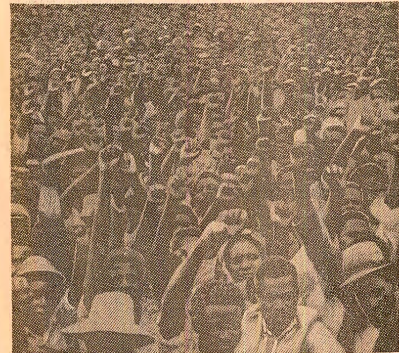
La Highfield, suburbie a orașului Salisbury, locuți aproape în exclusivitate de africani, in timpul unui mare miting popular își exprimă sprijinul entuziast față de Frontul Patriotic

„Febra aurului” a cunoscut, in aceste zile, o nouă și vertiginosă creștere, doborînd toate recordurile, calificate ca „incredibile” încă la sfîrșitul anului trecut. Astfel, in cursul săptămîinii ce s-a încheiat, metalul galben a fost cota la bursele occidentale între 632 și 689 de dolari unci (o uncie de aur fiind egală cu 31,1 grame). Ieri, la Hongkong, prețul unci a atins 675 dolari.