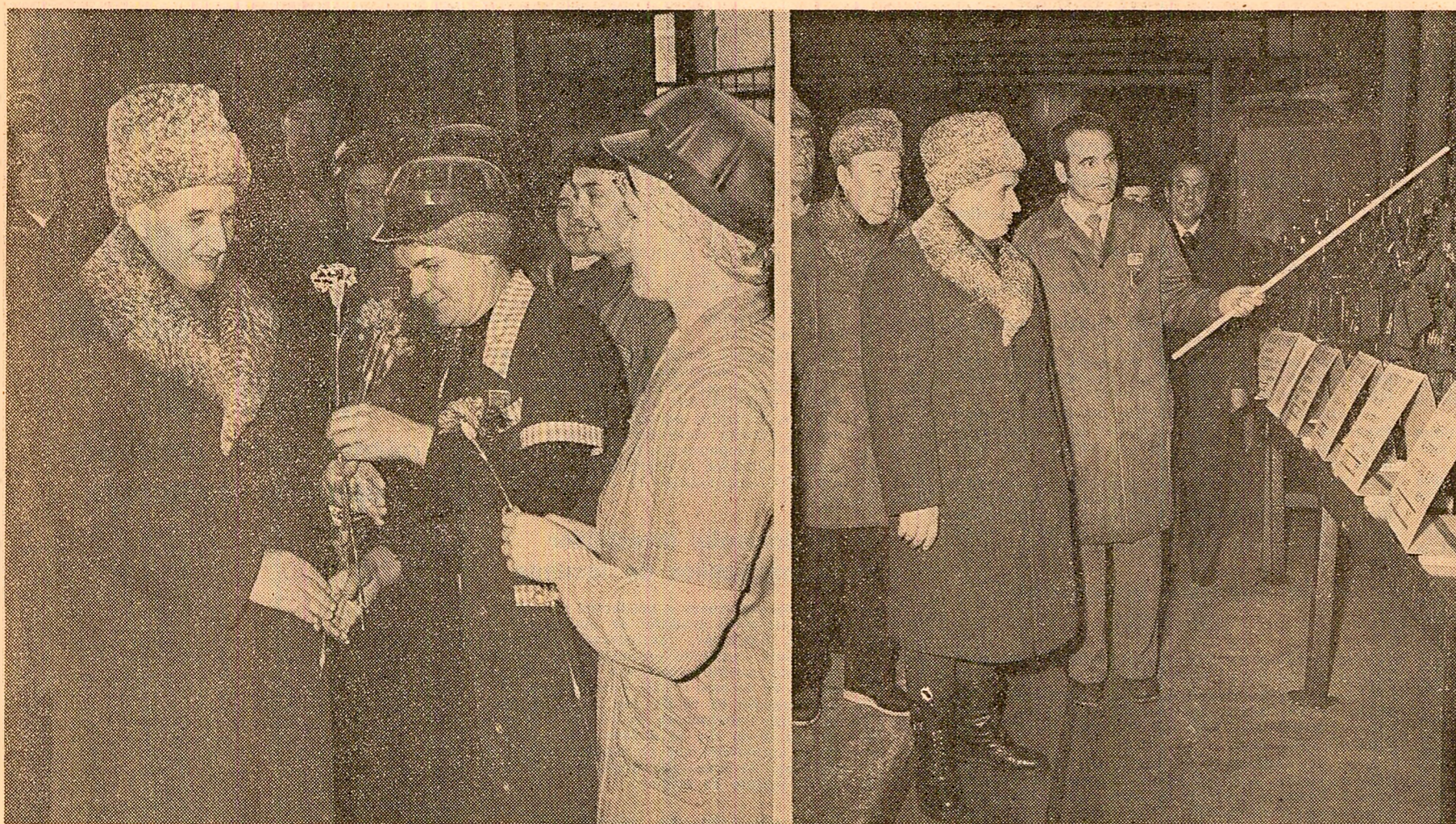
Un gest spontan, cu mare încălzură emoțională, exprimând bucuria reînălțării și a secretarului general al partidului