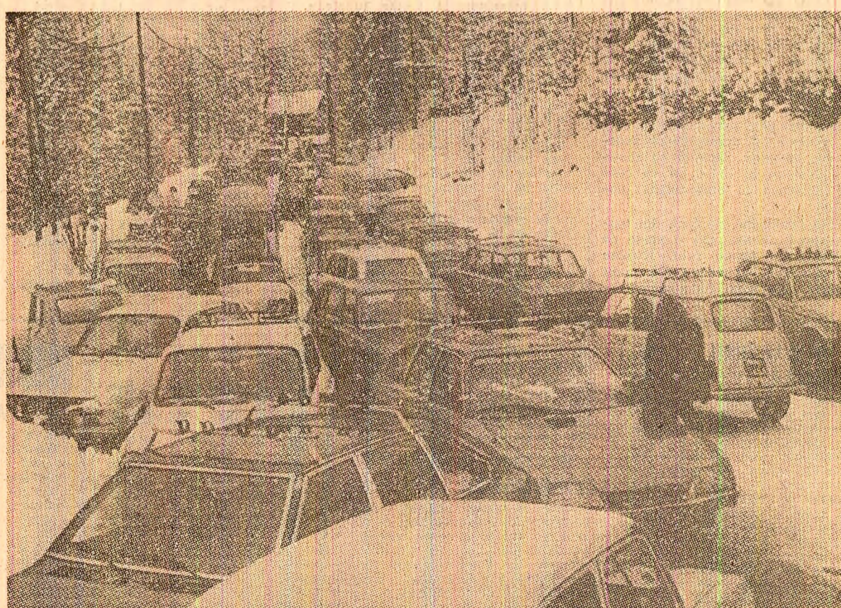
Căderile abundente de zăpadă au perturbat circulația rutieră în majoritatea țărilor europene. În fotografie: Pe o șosea din Franța, în apropiere de Grenoble, sute de mașini au rămas blocate din cauza zăpezii

Sînt măsuri semnificative în direcția micșorării numărului de „scurte-circuite rurale”, ilustrînd eforturile pentru învingerea unuia din cele mai grave fenomene subdezvoltării în țările latino-americane. Dar, așa cum a reieșit, dealtfel, ca una din concluziile principale ale reuniunii F.A.O., este necesară o mai mare consecvență în transformarea structurilor agriculturii, în conformitate cu cerințele progresului. Sau, cum scria un literat ecuadorian, „pentru ca pămîntul să rodească e nevoie nu numai de soare și de apă, ci și de un climat social-politic care să-i stimuleze fertilitatea...”