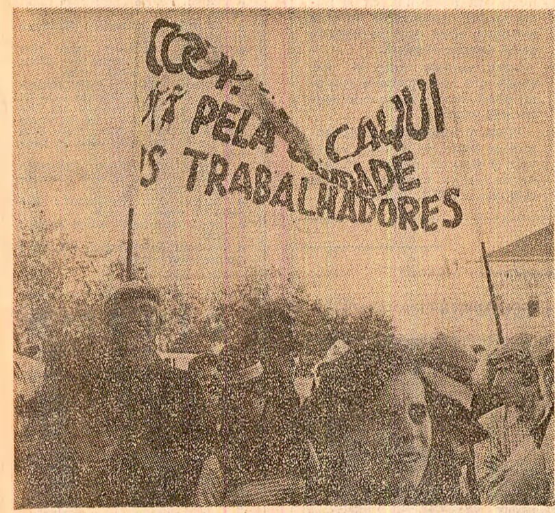
Demonstrație a fermierilor portughezi în sprijinul reformei agrare

Dacă extragerea petrolului comunității din minele vest-europene a costat, vreme îndelungată, mai scump decît importul petrolului, situația s-a schimbat simțitor în acest deceniu. Criza din 1973 și ridicarea vertiginosă a prețului „aurului negru” au redat cărbunelui vocația unei industrii rentabile și durabile. Într-adevăr, rezervele de cărbune ale „celor nouă” sînt considerabile. De fapt, în lumea întreagă există mari rezerve de cărbune, cifrate la un total de 4.995 miliarde de tone, din care 1.551 miliarde în Europa (inclusiv U.R.S.S.), 1.097 miliarde în Asia, 206 miliarde în Africa, 215 miliarde în America de Nord, 12 miliarde în America de Sud și 14 miliarde tone în Australia. Producția anuală actuală a Europei „celor nouă” este de 250 milioane de tone, în actuală industrie fiind angajați peste 500.000 oameni.