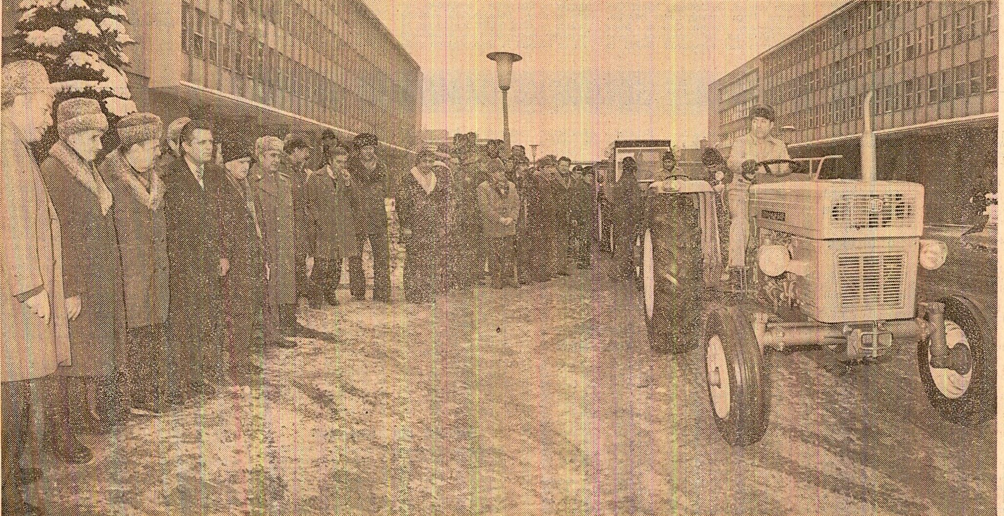
Constructorii de tractoare prezintă ultimele tipuri aflate în fabricația de serie sau în curs de asimilare.