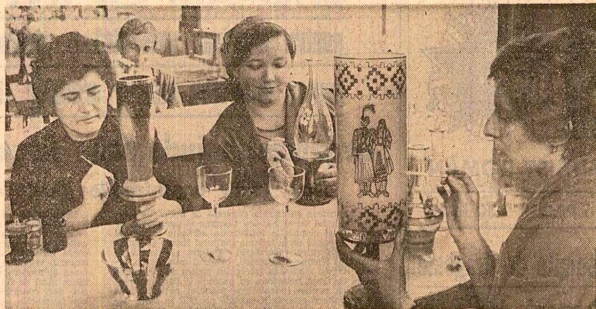
Fabrica de sticlă „Victoria muncii”, din Poiana Codrului, județul Satu Mare. Aspect din secția pictură.