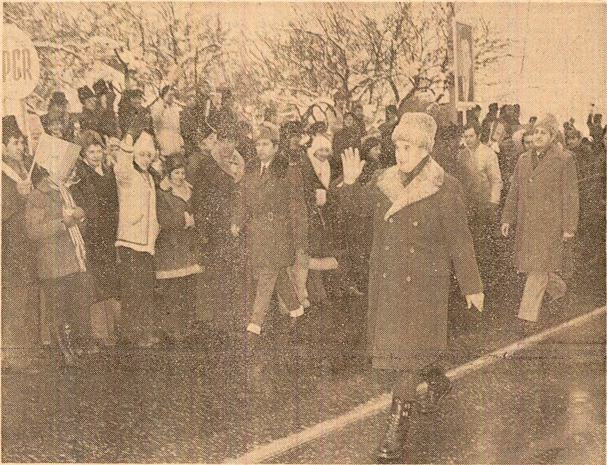
Primire deosebit de călduroasă la sosirea în Brașov

Joi, 10 ianuarie, secretarul general al Partidului Comunist Român, președintele Republicii Socialiste România, tovarășul Nicolae Ceaușescu, a efectuat o vizită de lucru în municipiul Brașov, unde a analizat, împreună cu reprezentanții organelor locale, cu cadre de răspundere din instituții economice centrale, cu specialiști și muncitori din localitate, problemele actuale și de perspectivă ale dezvoltării calitative a unor importante sectoare industriale.