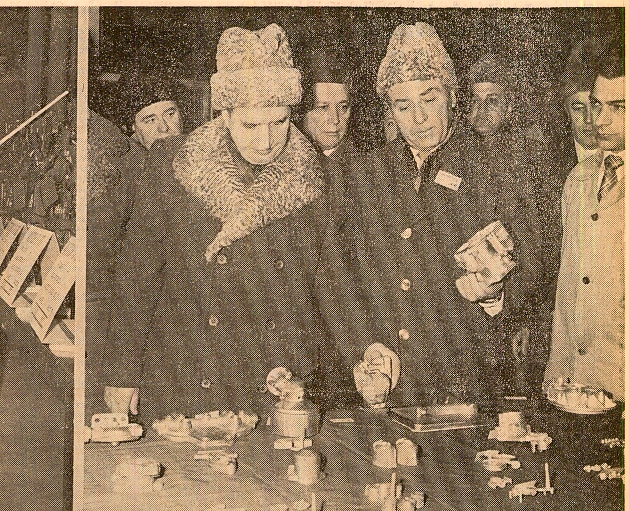
Modernizarea continuă a tehnologiilor și sporirea eficienței întregii activități productive — în prim planul analizei efectuate la Intreprinderea de tractoare (stînga) și la Intreprinderea nr. 2 (dreapta)

Prin importanța problematicii abordate, a concludiilor de însemnătate majoră pentru evoluția dinamică a economiei județului și a unor întregi sectoare industriale ale țării, vizita a reprezentat, totodată, un moment important nu numai pentru destinele unităților vizitate, ci și pentru dezvoltarea economiei noastre. Întreaga desfășurare a vizitei a pus, totodată, în evidență hotărârea fermă, de neclintit a oamenilor muncii brașoveni, a întregii noastre națiuni de a nu-și precupeți eforturile creatoare pentru transpunerea integrală în viață a istoricilor hotărâri ale Congresului al XII-lea, de a-și spori contribuția la progresul rapid, multilateral al scumpei noastre patrii, Republica Socialistă România.