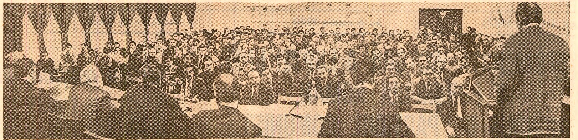
„Noi stăpînim — noi hotărîm — noi acționăm”: o adunare generală a oamenilor muncii la Combinatul siderurgic Galați