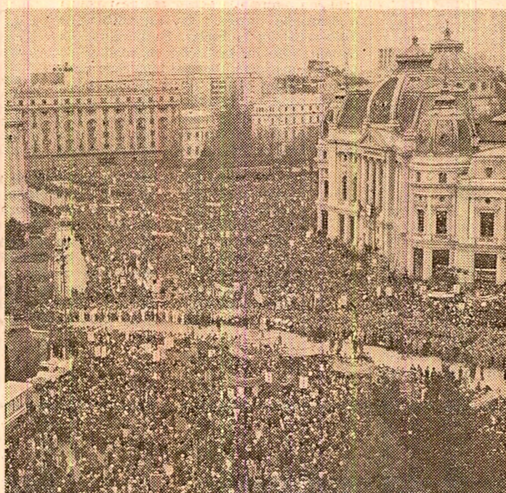
Piața Palatului, noiembrie 1979: zeci de mii de oameni ai muncii ovacionează pe secretarul general al partidului