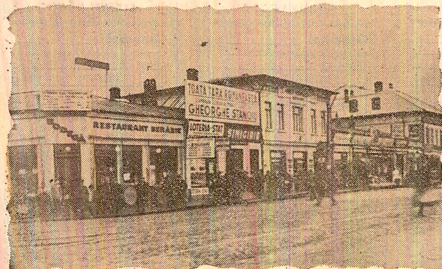
Cartierul Obor în 1945...