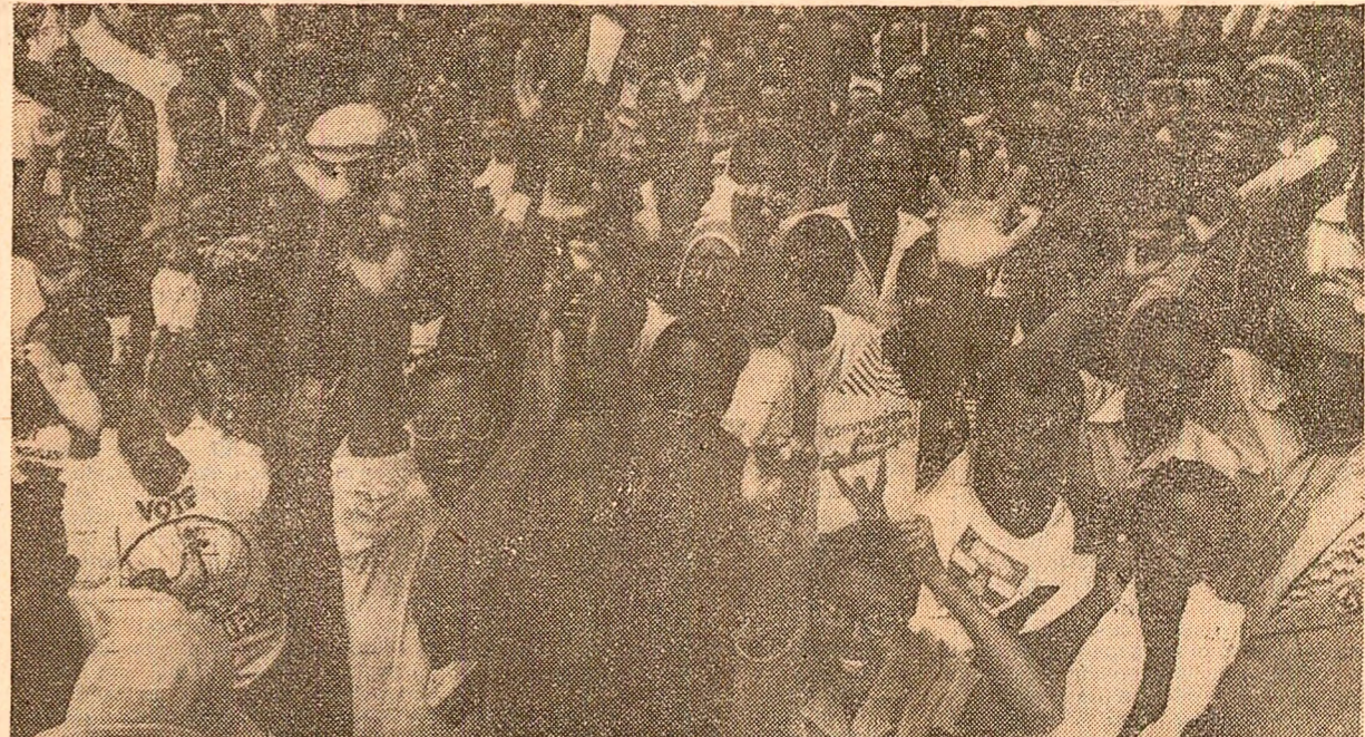
Uriașă revărsare de entuziasm pe străzile și în piețele din cartierele locuite de africani ale capitalei rhodesiene, imediat după aflarea rezultatelor alegerilor.