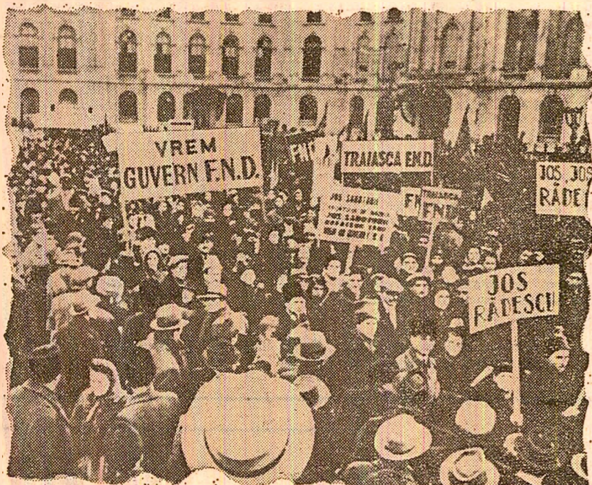
Piața Palatului, în februarie 1945: masele muncitoare cer un guvern democratic