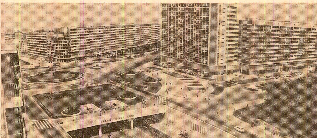
...și în 1980

Priviți cu atenție aceste fotografii. Așa cum sînt aici așezate, ele ne vorbesc despre o istorie densă, despre viață, de luptă. Două importante puncte ale Capitalii țării, fotografiate în martie 1945 și în martie 1980. Între un moment și altul România a parcurs în timp, în spațiul evoluției politice, economice, sociale, o distanță de secole. Alături de eunosca Piața a Palatului, în iarna anului 1945 — o vatră ierburie din care s-a ridicat și s-a împus cu fîră flacăra voinței poporului de a-și instaura puterea, de a încredința conducerea țării forțelor înaintate, progresiste, partidului clasei muncitoare, care să-l reprezinte cu adevărat. Udată atunci cu singele mulțimii mitraliate, piața aceasta a rămas ca burnă de aur în istoria revoluției socialiste din România. La evenimente politice cardinale — cum a fost și Congresul al XII-lea al partidului — această larvă suprațată din inima orașului și a țării este astăzi inundată de ireamătul, de cîntecul, de florile și aclamațiile a mii și mii de oameni care-și manifestă, vie și deschisă, bucuria pentru împlinirile din acest răstimp istoric, încercarea și înalta în jurul partidului, sentimentele de înaltă prețuire și dragoste față de cel mai iubit dintre filii ai acestui popor, tovarășul Nicolae Ceaușescu.