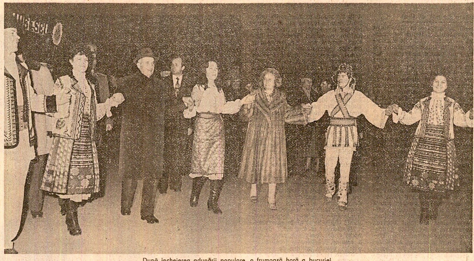
După încheierea adunării populare, o frumoasă horă a bucuriei

Aflîndu-ne în pragul aniversării Zilei internaţionale a femeii, aducem, cu acest prilej, gândurile noastre de respect şi preţuire faţă de tovarăşa Elena Ceauşescu, militantă de seamă al partidului nostru, eminent om de ştiinţă, adresîndu-i omagiale cele mai calde ale femeilor patriei noastre. Stimăm fiecare dintre noi, cetăţeni ai acestei ţări, în care munca este supremă valoare şi împlinire, programul cu care se prezintă în alegeri Frontul Democratice şi Unităţii Socialiste, cuprinzînd, în esenţă, coordonatele dezvoltării viguroase a industriei, agriculturii, ştiinţei şi culturii, ale creşterii calităţii vieţii, stabilite de Congresul al XII-lea al Partidului Comunist Român, reprezentînd un program concret de acţiune, care pune în faţa clasei muncitoare, a sindicatelor, sarcini deosebite. Parte componentă a Frontului Democratice şi Unităţii Socialiste, sintedele vor acţiona pentru realizarea exemplară a planului producţiei fizice, a celei nete, pentru îmbunătăţirea calităţii produselor, reducerea continuă a consumului de materii prime, materiale, combustibili şi ener-