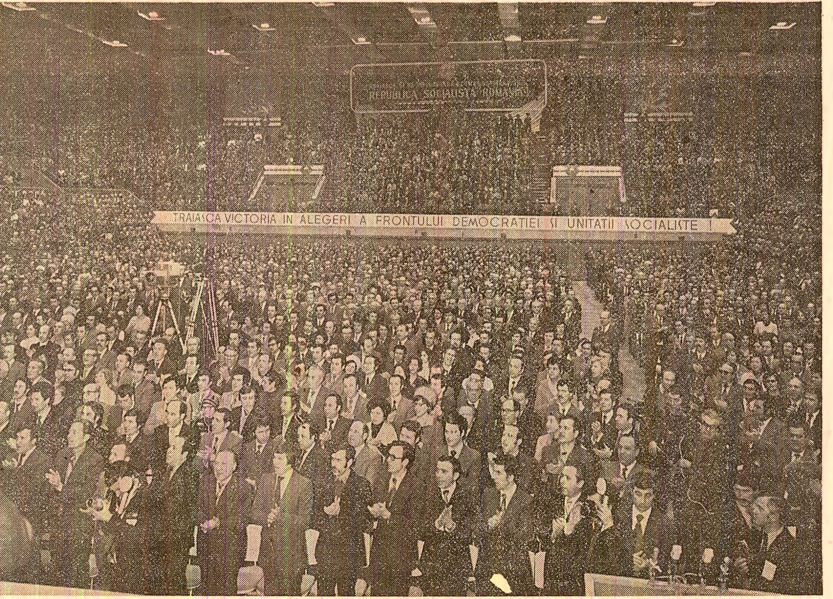
(Continuare în pag. a III-a)

În același timp, este necesar să se asigure buna întreținere a fondurilor fixe și realizarea la timp și la un înalt nivel tehnic a reparațiilor capitale. O atenție deosebită va trebui acordată creșterii eficienței întregii activități economice, realizării producției nete, reducerii cheltuielilor de producție, îndeosebi a cheltuielilor materiale. Organizațiile de