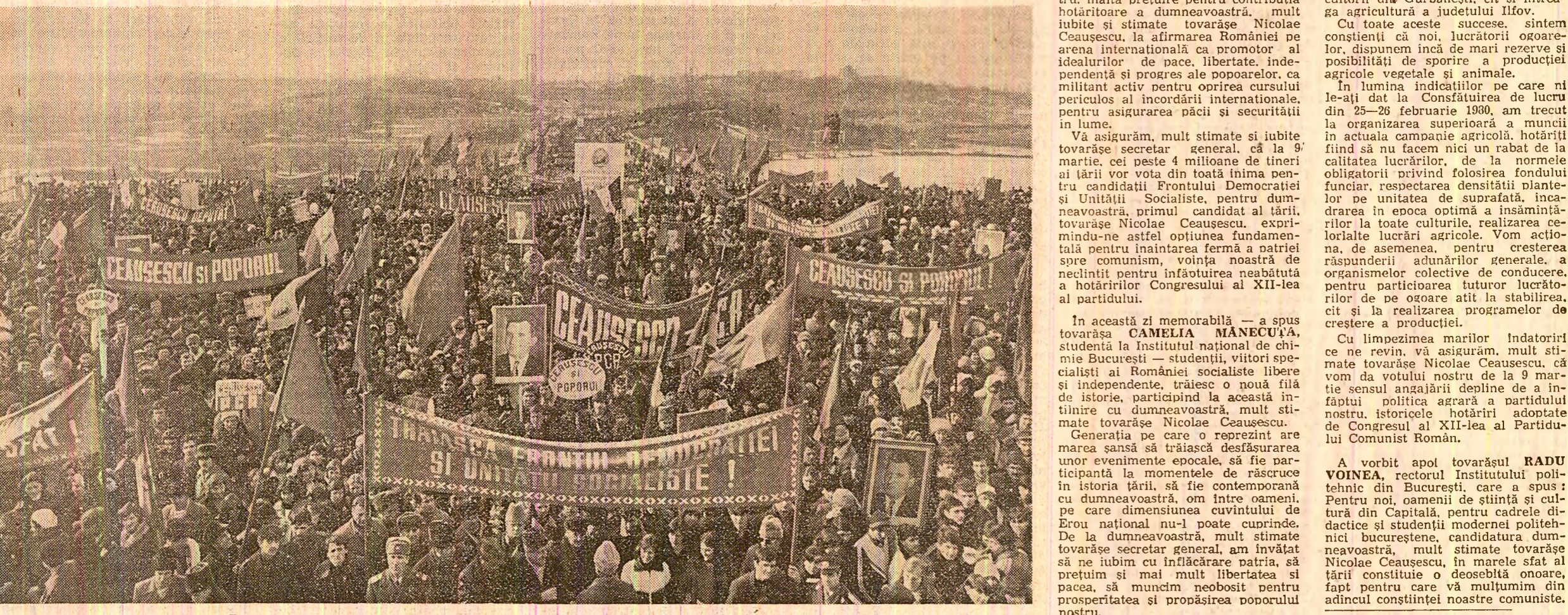
Zecile de mii de bucureşteni ovationează pentru partid, pentru secretarul său general

Hotărîţi să amplificăm aceste succese, vom da cu toată convingerea votul nostru candidaţilor Frontului Democratice şi Unităţii Socialiste, vînd pentru politica internă şi externă a Partidului Comunist Român, pentru înalţarea viguroasă a patriei spre orizonturile tot mai luminoase ale civilizaţiei socialiste, ale comunistului.