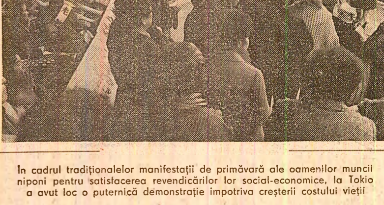
În cadrul tradiționalelor manifestații de primăvară ale oamenilor muncii niponi pentru satisfacerea revendicărilor lor social-economice, la Tokio a avut loc o puternică demonstrație împotriva creșterii costului vieții.

BONN 6 (Agerpres). — În ultima jumătate de an, numărul organizațiilor și grupărilor neofasciste care activează în R.F. Germania a sporit de la 120 la 180, se arată într-un document dat publicității la Frankfurt de Main de Uniunea antifascistă.