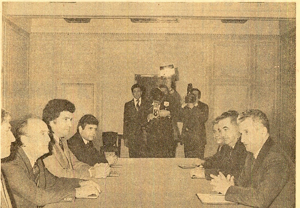
Tovarășul Nicolae Ceaușescu, secretar general al Partidului Comunist Român, prezintă delegației Socialiste din Cipru, condusă de Vassos Lyssarides, președintele partidului, care face o vizită în țara noastră, la invitația C.C. al P.C.R.

Ieri, colectivul Întreprinderii de cazane mici și arzătoare din Cluj-Napoca și-a îndeplinit prevederile planului la export pe întregul cincinal. Întreprinderea exportă utilaj termoelectric în mai toate țările ale lumii. Colectivul de muncă de aici se află, de asemenea, în avans cu 240 de zile la realizarea planului cincinial. Aceasta înseamnă că până la sfârșitul acestui an se va putea realiza peste prevederi o producție de 530 milioane lei.