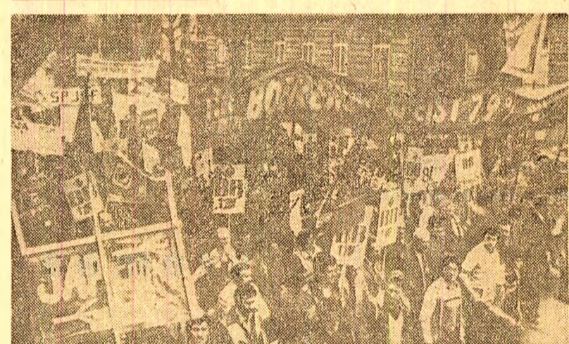
Reprezentanți ai fermierilor din țările Pieței comune demonstrează pe străzile orașului Strasbourg