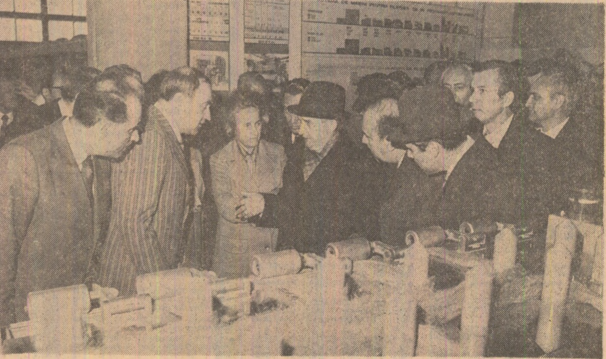
Aspecte din timpul dialogului de lucru