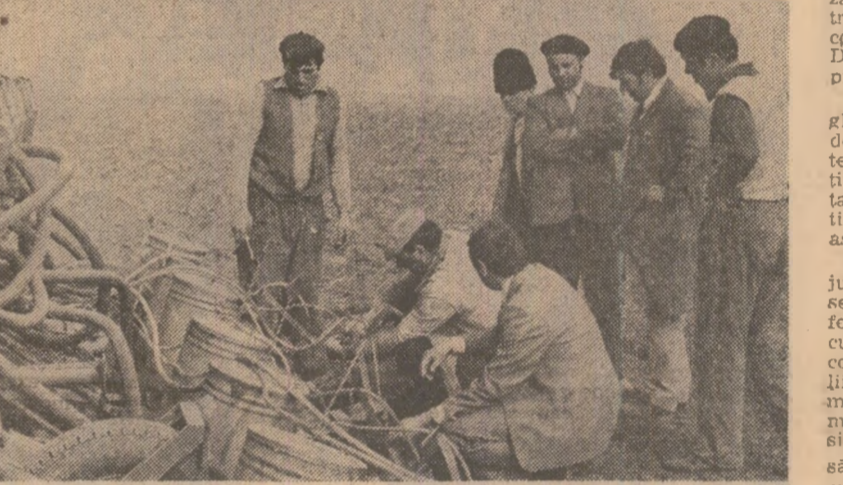
C.A.P. „8 Martie” Chirnovi. Era trecut de emiază și această semănătoare, în jurul căreia se învîrteau fără rost alții oameni, se cădea încă să intre în brazdă