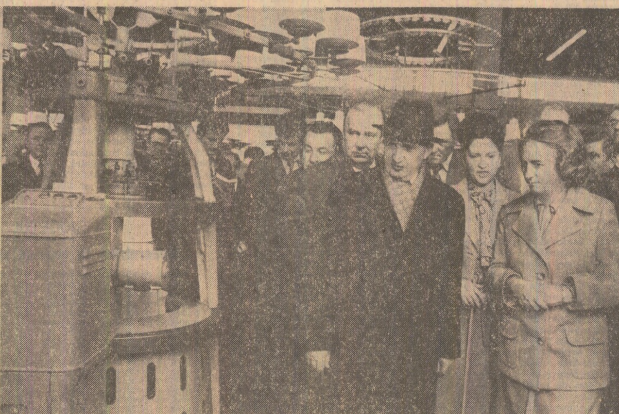
În cadrul dialogului de lucru se analizează noi căi și modalități privind creșterea eficienței în diferite sectoare ale economiei naționale