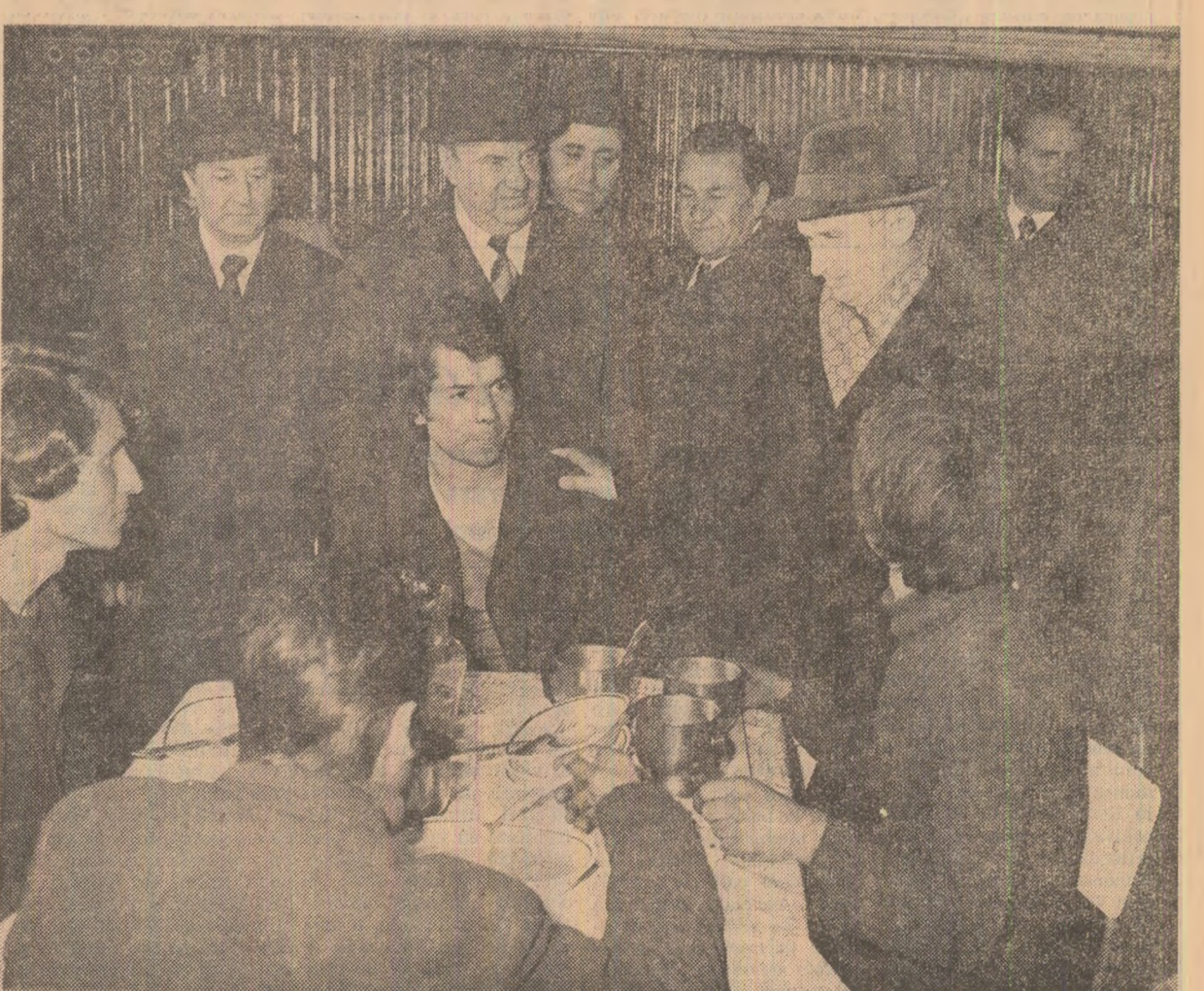
La cantina-restaurant a întreprinderii

curs de asimilare să se situeze la cel mai înalt nivel tehnic. În sectorul utilajelor de recoltare au fost luate în discuție gradul de mecanizare și calitatea lucrărilor efectuate cu mașinile existente. Gazdele au arătat că în institut a fost conceput un agregat pentru stringerea recoltei de sfeclă. Tovarășul Nicolae Ceaușescu a cerut să se studieze posibilitatea de a îmbunătăți în continuare acest utilaj, pentru a se asigura recoltarea fără pierderi. Specialiștii s-au angajat să soluționeze, într-un timp cît mai scurt, pe baza recomandărilor făcute, această problemă de maximă însemnătate.