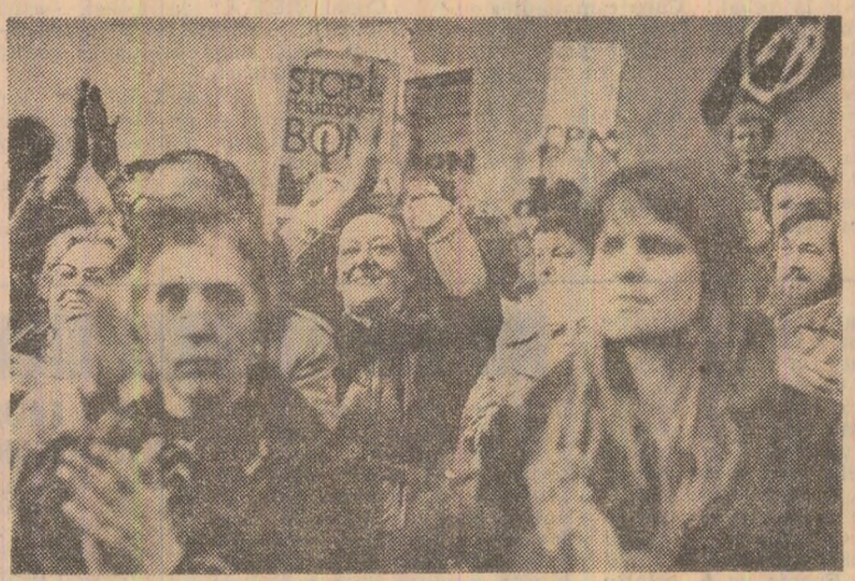
Femei olandeze, aparținînd tuturor categoriilor sociale și avînd diverse convingeri politice, cer scoaterea în afara legii a armelor nucleare și înfăptuirea altor măsuri de dezarmare