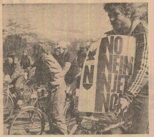
„NU — înarmării!”. Sub această lozincă, filiala din landul Hesse (R.F.G.) a tineretului socialist și social-democrat a organizat o „Cursă ciclistă a păcii”