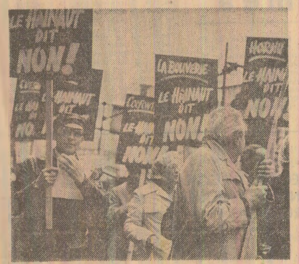
Demonstrație desfășurată la Bruxelles din inițiativa Partidului Comunist din Belgia împotriva intensificării cursei înarmărilor

...comuniști ...socialiști și social-democrați ...femeile ...tineretul