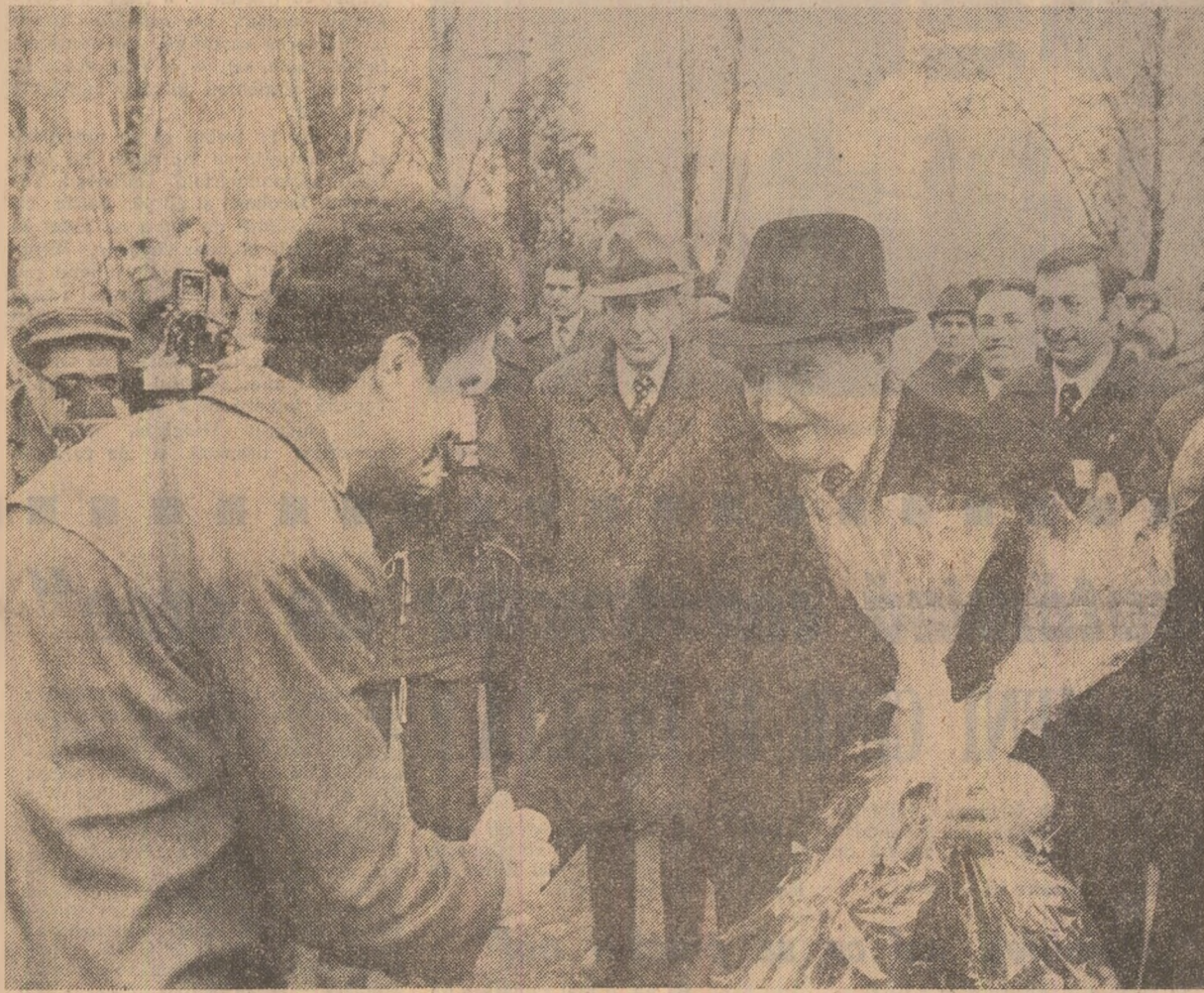
Primire călduroasă la marea întreprindere „Semănătoarea”

La acest amplu dialog cu oamenii muncii, cu specialiști din producție, din cercetare și proiectare, în domeniul mecanizării agriculturii, în cadrul căruia a fost examinat modul cum se îndeplinesc recomandările și indicațiile date de secretarul general al partidului cu prilejul vizitei din 11 noiembrie 1979 la întreprinderea agricolă de stat Afumați, privind îmbunătățirea și perfecționarea continuă a mașinilor agricole, au luat parte tovarășii Ilie Verdet, George Oprea, Gheorghe Pană.