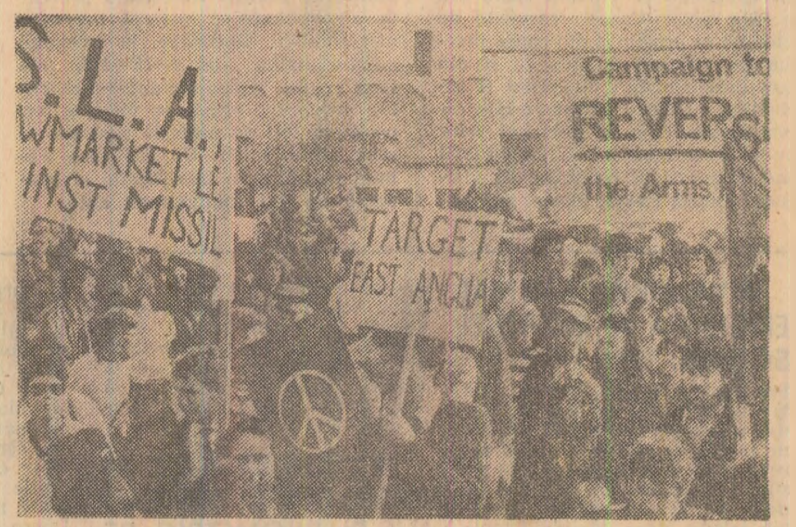
Marș organizat de reprezentanți ai tineretului din Marea Britanie împotriva hotărîrii privind amplasarea de noi rachete nucleare în Europa, pentru trecerea la măsuri efective de dezarmare