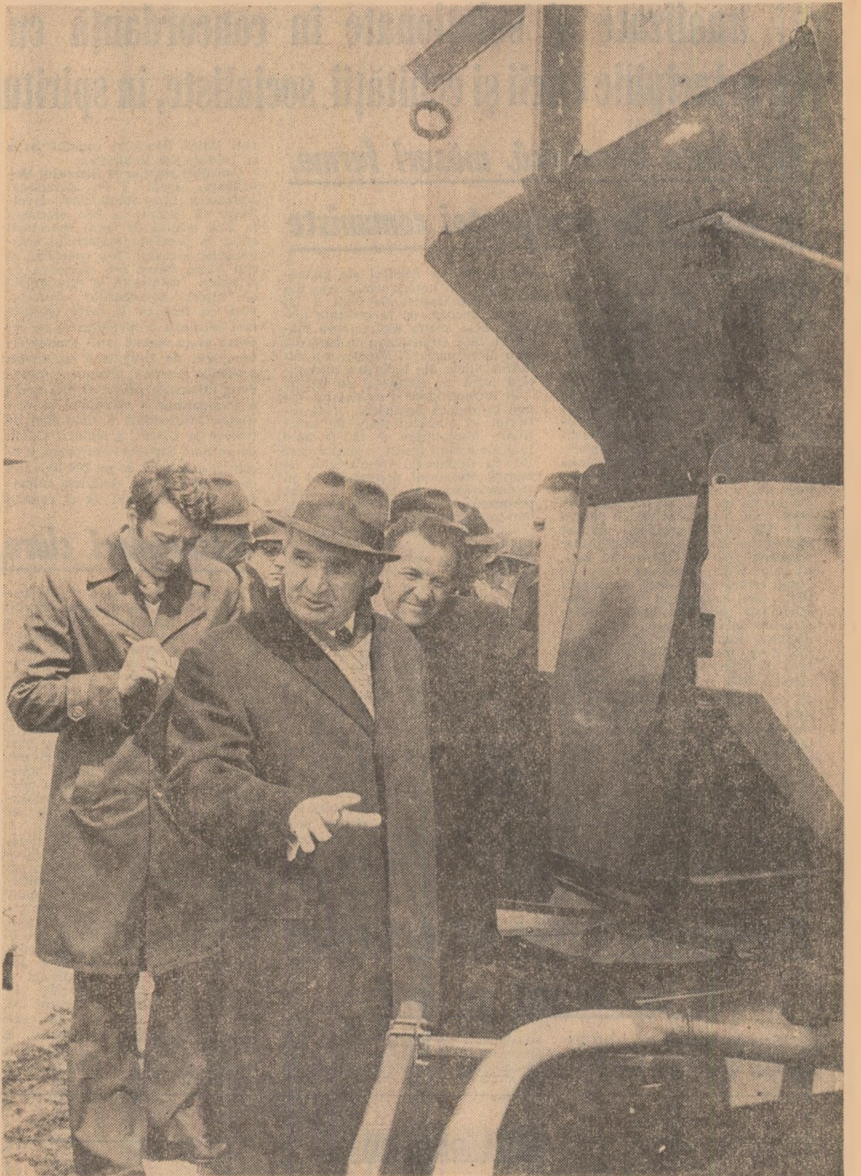
Se examinează noile tipuri de mașini agricole realizate de cercetători și proiectanți

Reține atenția o recentă creație a institutului — prototipul semănătorii pentru plante prăsoitoare pe 12 rânduri, experimentată cu bune rezultate și care urmează să intre în fabricația de serie. Revenind asupra necesității efectuării concomitente a mai multor operații, tovarășul Nicolae Ceaușescu a recomandat ca în ceea ce privește utilajele folosite la însămînțări și plantări să se aplice rapid modernizarea agregatelor existente, iar cele care sint în