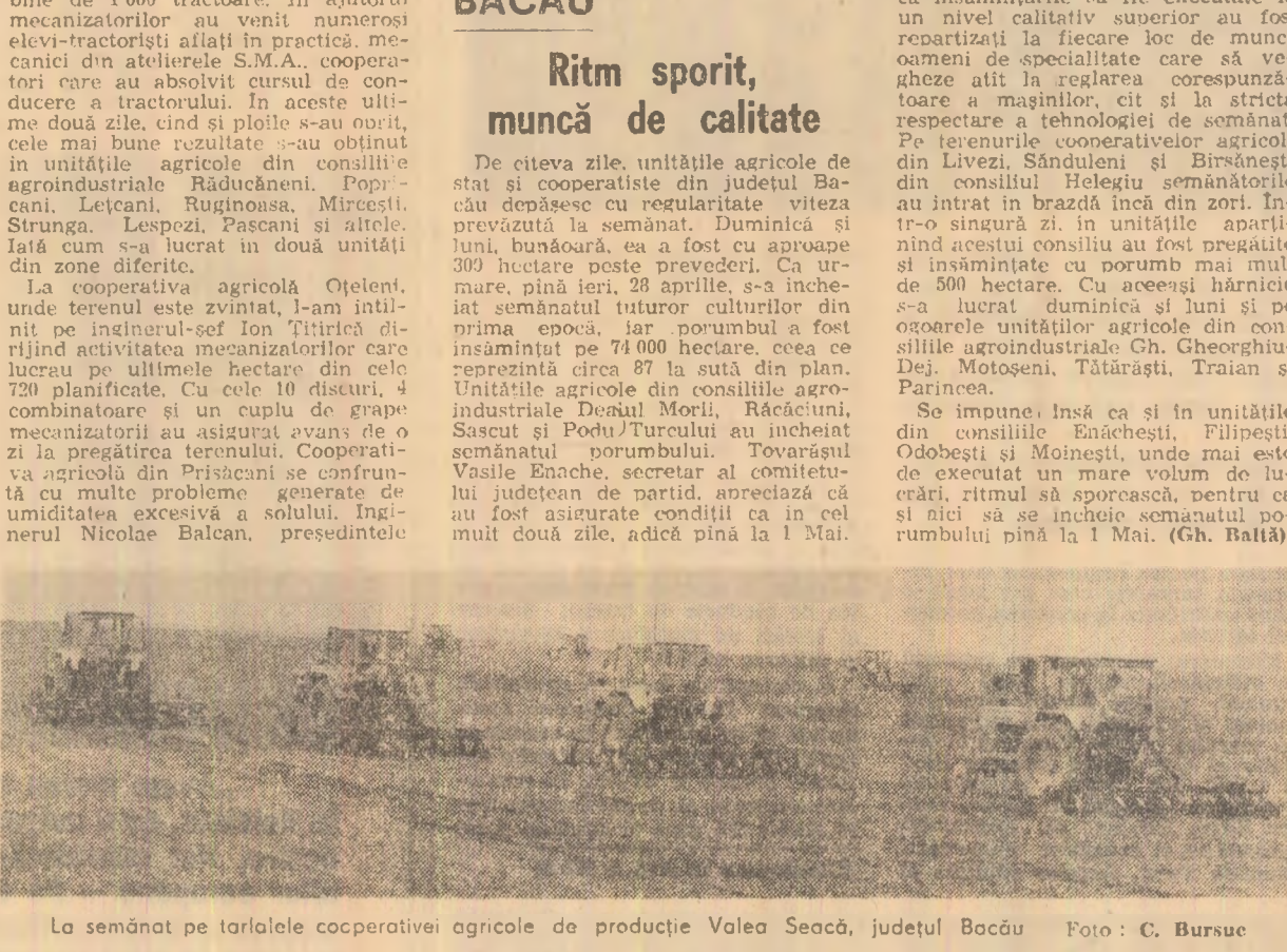
La semănat pe tarlalele cooperative agricole de producție Valea Seacă, județul Bacău.