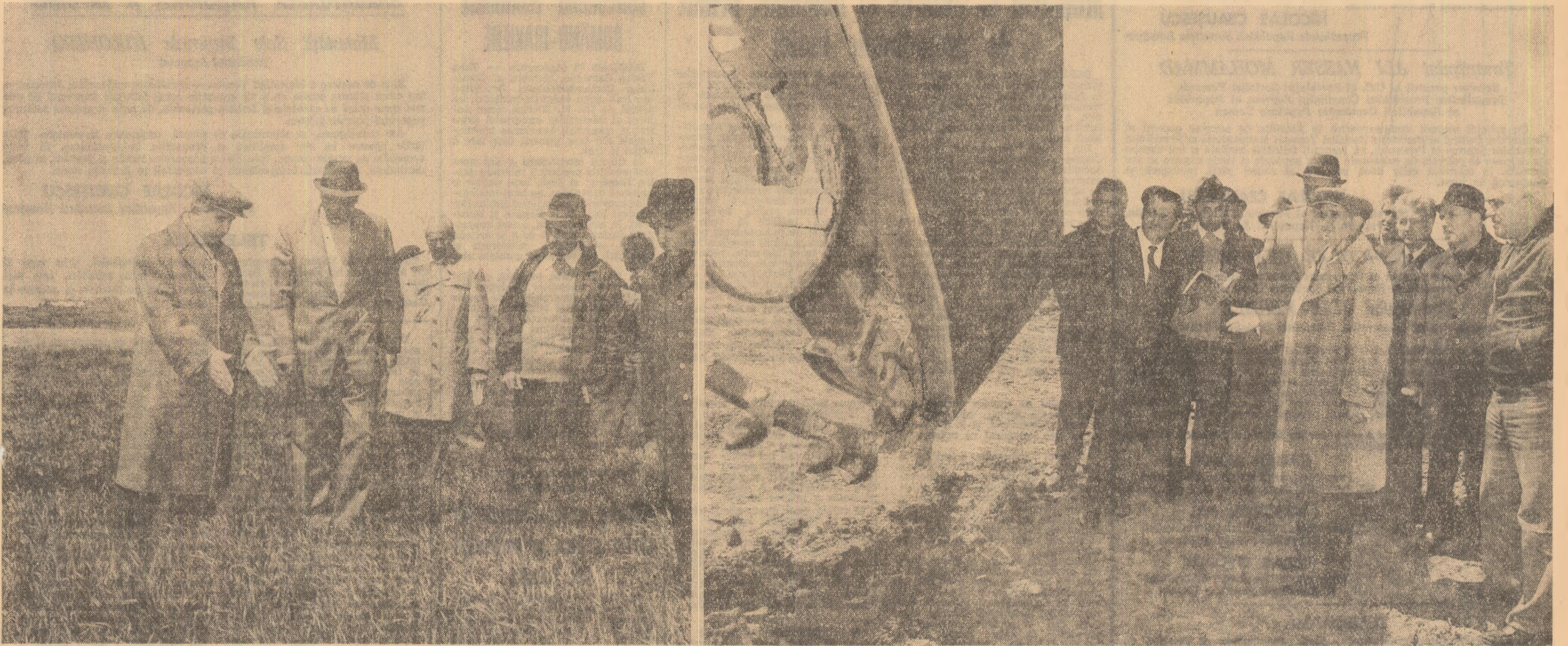
Ca în altele rânduri, tovarășul Nicolae Ceaușescu, consultându-se cu oamenii muncii, cu specialiștii, cere să se acționeze cu hotărâre pentru realizarea unei agriculturi moderne, pentru creșterea producției agricole, punând în valoare, cu mai multă energie, forța de muncă și mijloacele tehnice cu care sînt înzestrate unitățile economice