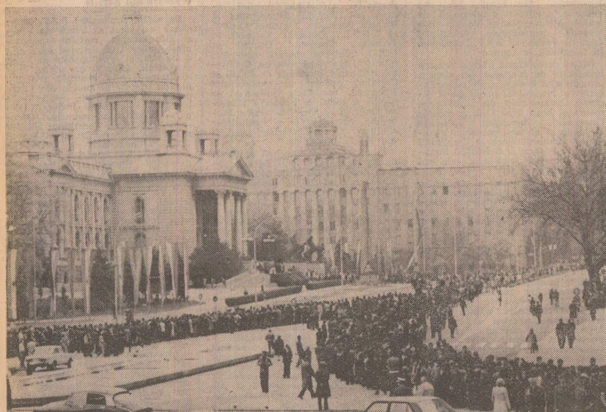
Coloane nesfârșite de cetățeni se îndreaptă spre aula Adunării R.S.F.I., unde se află depus sicriul cu corpul neînsoțit al președintelui Iosip Broz Tito, pentru a aduce un ultim omagiu iubitului lor conducător