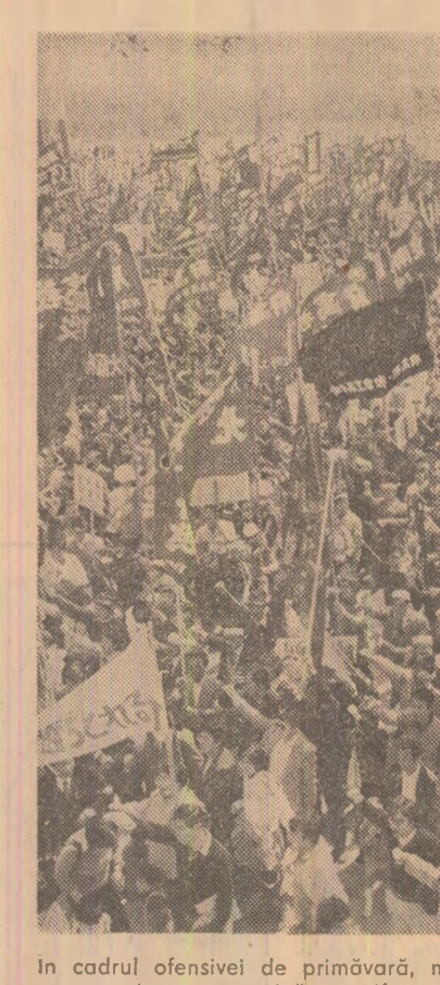
În cadrul ofensivei de primăvară, mii de delegați sindicali reuniți la Tokio au organizat o puternică manifestație, cerind îmbunătățirea condițiilor de lucru și de viață ale muncitorilor

Pe de altă parte, sursele citate informează că președintele Godfrey Binaisa se află la rediția sa de la Entebbe, din apropierea capitalei, un purtător de cuvânt al acestuia arătând că el intenționează să-și exercite în continuare funcția de șef al statului.