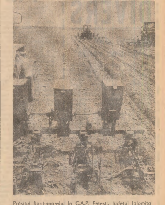
Prășitul florilor-soarelui la C.A.P. Fetești, județul Ialomița

Menținerea timpului nefavorabil în multe zone ale țării — frecventeaverse de ploaie, însoțite de o scădere a temperaturii aerului — impune ca o cerință esențială pentru această perioadă intensificarea la maximum a lucrărilor de întreținere a culturilor. Și aceasta deoarece pentru buna dezvoltare a plantelor prășitoare sint obligatorii distrugerea buruienilor și a crustei formate la suprafața solului din cauza ploilor. Orice prășire făcută acum este vitală pentru realizarea recoltelor prevăzute în acest an și, de aceea, executarea neîntîrziată a lucrărilor de întreținere trebuie privită pretutindeni ca o sarcină prioritară, de mare răspundere.