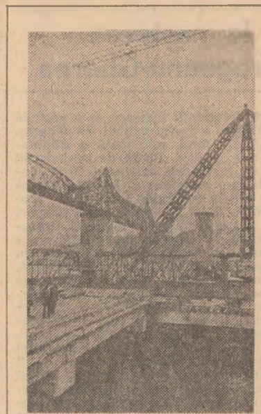
Realizări ale constructorilor podului de la Cernavoda