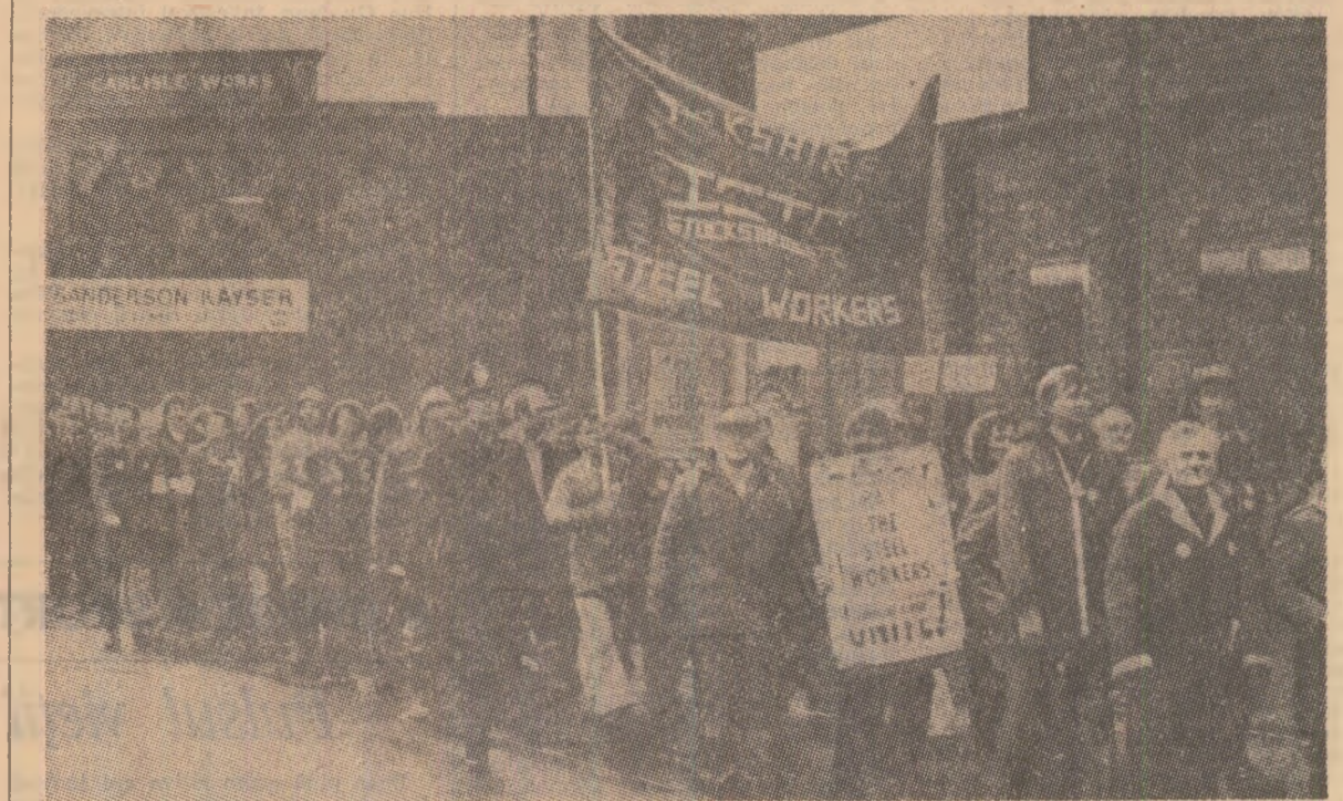
În localitatea britanică Sheffield, muncitorii oțelari protestează împotriva noilor reduceri ale locurilor de muncă