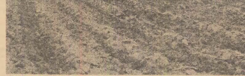
Pe ogarele I.A.S. Piatra, județul Teleorman, se execută prima prașilă mecanică la floarea-soarelui