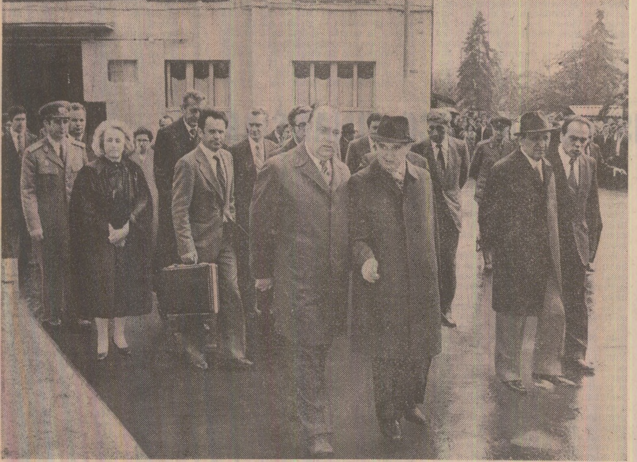
În timpul vizitei la întreprinderea „Unirea”