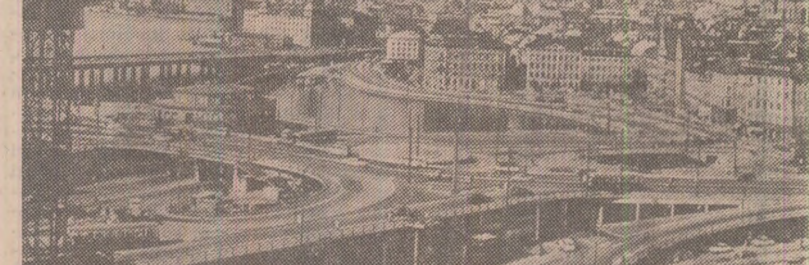
Asezat într-un peisaj insular, dominat de grurile de apă care unesc lacul Mălar cu Balica, Stockholmul și-o altă orășel de „Veneție a Nordului”.