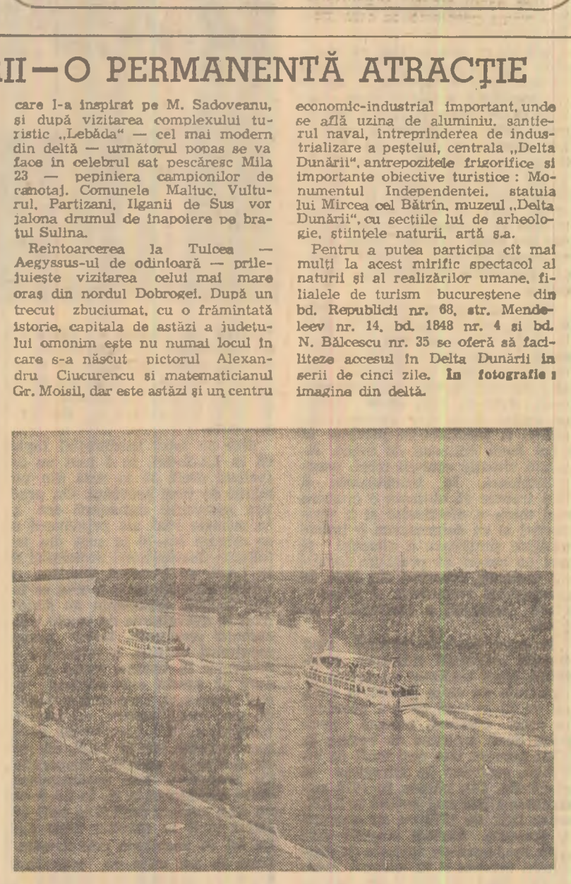
Imagina din delta.