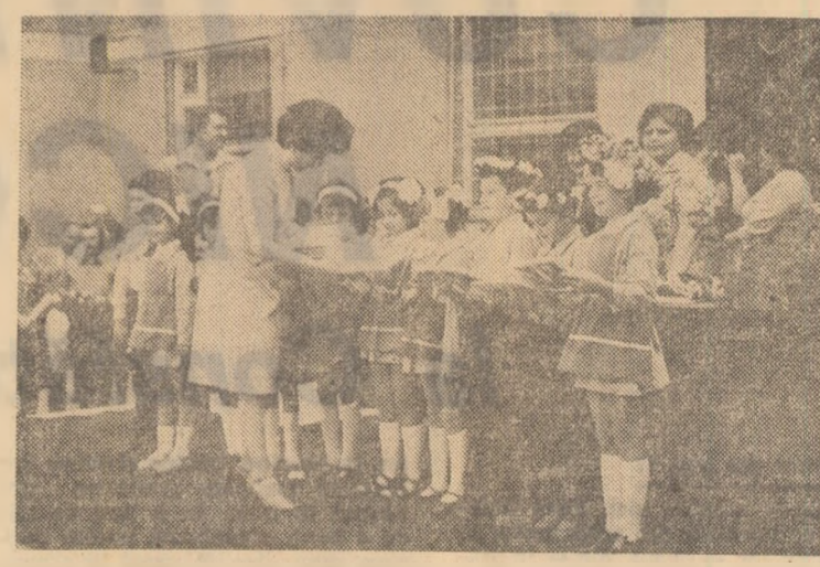
Aspect de la festivitatea de premiere de la Școala generală nr. 178 din cartierul bucureștean „Pajura”

Cei peste 3 milioane de elevi ai claselor I-VIII și-au sărbătorit, duminică, premiinții — colegii cei mai harnici la învățătură, cei mai activi în acțiunile pionieresti. Serbările de sfîrșit de an ale elevilor claselor primare și gimnaziale, prilej de bilanț la învățătură și în activitatea obștească, au reunit în cadrul festiv al școlilor, împodobite sărbătorește, profesori și părinți, reprezentanți ai organelor locale de partid de stat, ai formurilor de învățămînt, ai organizațiilor de tineret. După decernarea premiilor școlare și distincțiilor pionieresti, formațiile artistice ale elevilor participante la cea de-a III-a ediție a Festivalului național „Cîntarea României” au prezentat spectacole.