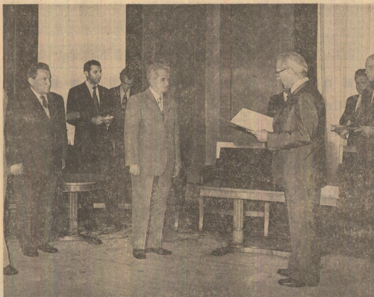
Persoanele oficiale române și din R. D. Germană, prezente la solemnitate, l-au felicitat cu multă căldură pe tovarășul Nicolae Ceaușescu.

Erau de față ambasadorul României la Berlin și ambasadorul R. D. Germane la București.