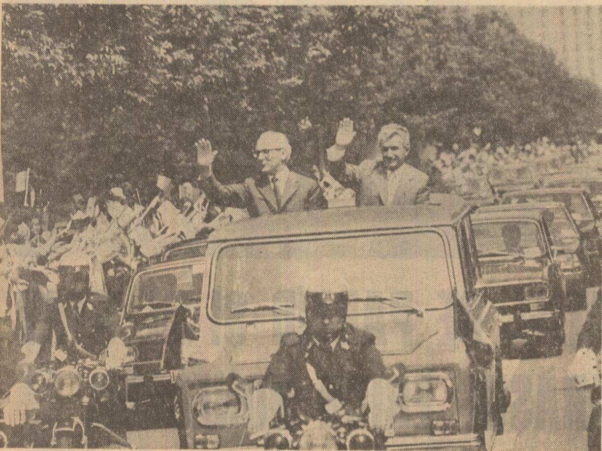
Tovarășului Nicolae Ceaușescu i-a fost înminat, de către tovarășul Erich Honecker, Ordinul „Karl Marx”