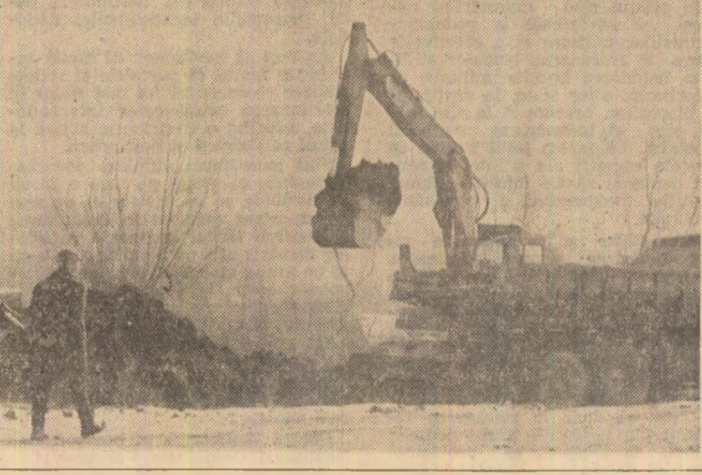
Fotografiile înfîșează drumul parcurs în realizarea instalațiilor — de la prima cupă de pămînt (stînga) la prima „șarjă” de drojdie furajată (dreapta).

unul grup de specialiști de la alte unități la Fabrica de chibrituri București; specialiștii de la Centrul de prelucrare a lemnului și Institutului de cercetări și proiectări pentru industria lemnului vor acționa ca asistenți tehnici suplimentari; reorganizarea controlului de calitate pe fiecare fază de lucru; funcționarea în două schimburi a liniei pentru confecționarea cutiilor de carton.