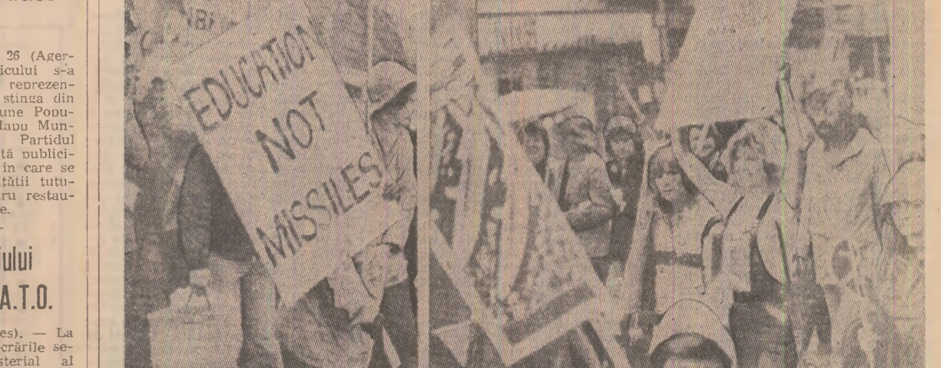
La Londra au avut loc, sub egida Partidului Laburist, de opoziție, un marș și un miting de protest, în Hyde Park, împotriva cursei înarmărilor nucleare...