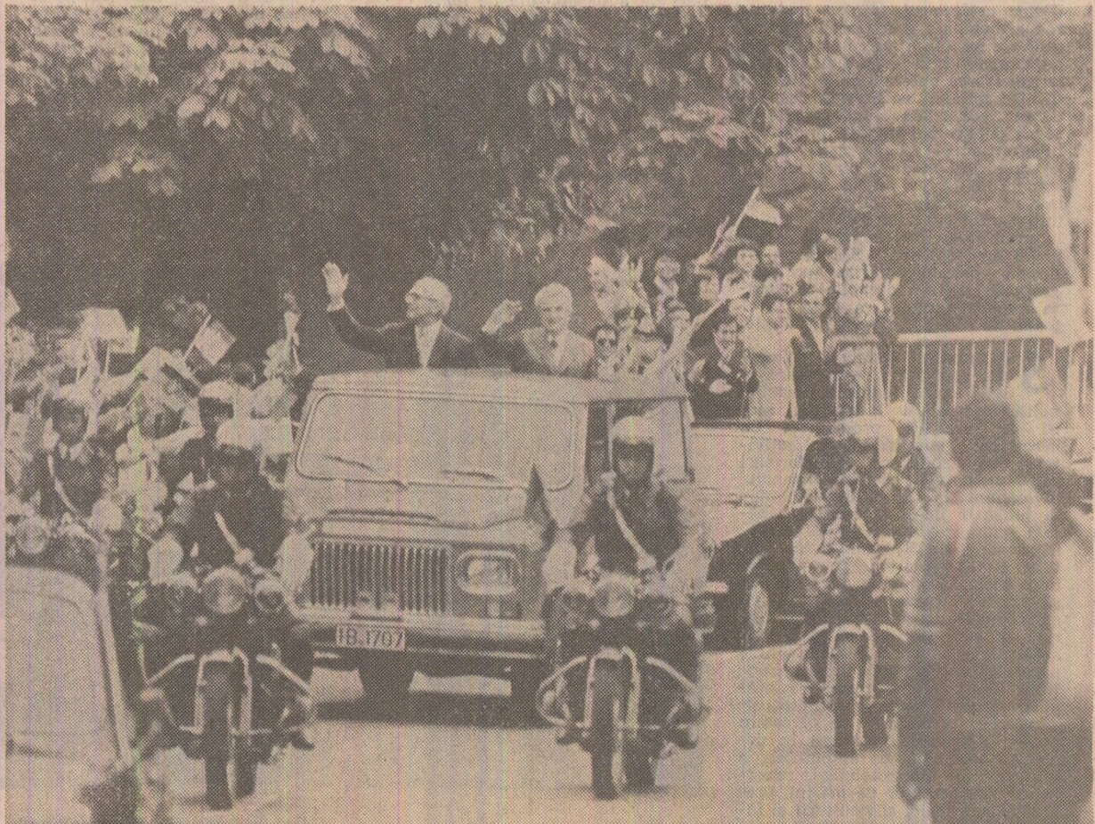
Populația din Sinaia aclamă pe înalții oaspeți