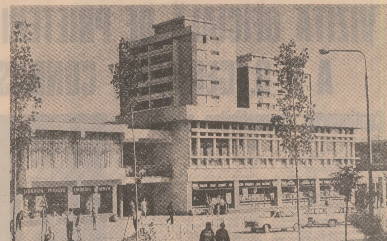
Sibiu. Imagine din modernul cartier de locuințe „Hipodrom”

— „Nu, înăuntru nu-i „leopardu”. Tencuieii drepte ca sticla, în unghiuri perfecte de 90 de grade, zugrăvile care învâluie fiecare încăpătoare într-o lumină caldă, familiară, usi și ferestre îngrijit lucrate, vopsite în două și trei straturi, care le dau o lucire alb-lăptoasă de email, instalații lucrate ca la carte, iată ce se poate spune despre lucrările de interior. Unor cititori, imaginile de mai sus ar putea să le pară exagerate sau educaționale ori, cel puțin, de excepție. Nu este însă așa. Sînt imagini de încredere pentru muncă serioasă și talentate meșteri. Întreprinderii județene de construcții-montaj Sibiu, întreprindere ce a sărbătorit recent 30 de ani de la înființare. Bineînțeles, nu vîrsta, sau nu numărul vîrștii colectivului explică succesul. Există și alte cauze foarte precise ale renumelui de care se bucură acest colectiv. Înainte de a le analiza însă, considerăm-le pe cele ale unei experiențe ce merită să fie avută în vedere — vom mai aminti câteva date monografice. Pornind „la drum” cu 105 constructori, cu 20 roabe de lemn, dotă-