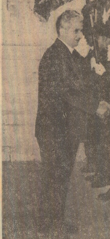
Cu prilejul depunerii unei coroane de flori la Monumentul soldatului necunoscut, înalțul oaspete român este salutat călduros de un grup de foști combatanți

Țările noastre se află la două extreme ale Europei, au orizonturi sociale diferite! Dar, cu toate acestea, între ele s-au dezvoltat și se dezvoltă o colaborare strînsă, în toate domeniile. Și aceasta, pentru că ambele popoare sînt animate de spiritul răspunderii față de cauza păcii, colaborării și independenței naționale a popoarelor. Pornim de la faptul că, în noile condiții internaționale, trebuie respectat neapărat dreptul fiecărui popor de a fi de deplin stăpîn de destinele sale, de a-și elabora calea dezvoltării în mod independent, fără nici un amestec din afară.