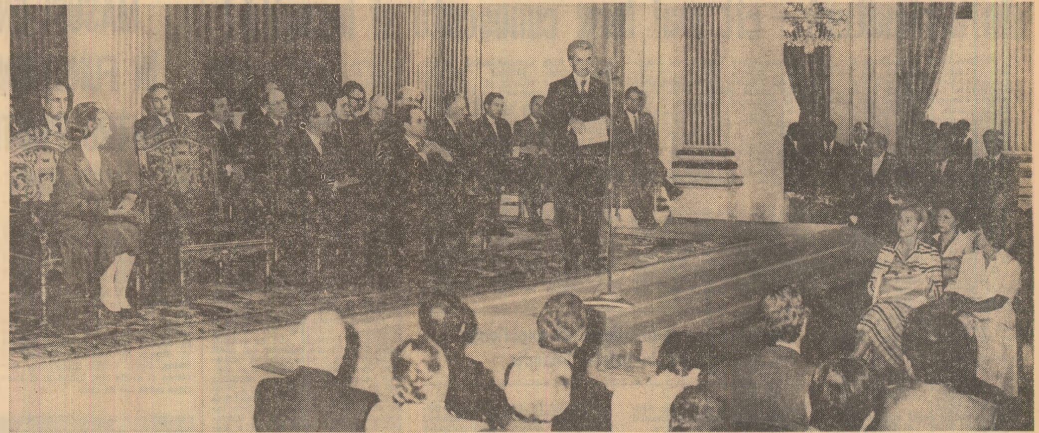
În timpul vizitei la Primăria Parisului

Parisul nu poate decât să se alăture la aceasta. De asemenea, sint fericit să vă exprim sentimentele de prietenie și simpatie pe care le am față de persoana dumneavoastră, față de marea țară pe care o reprezentăți, ca și față de poporul valoros și mândru căruia eu fi adresez urări de fericire, de progres și pace. (Aplauze).