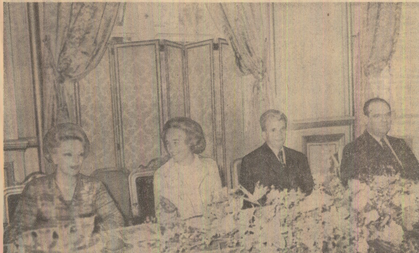
La dejunul oferit de primul ministru francez

temă-program elaborată de Institutul de medicină fizică, balneologie și recuperare medicală din București, în perspectivă adăugîndu-se actualului profil și o secție de recuperare locomotorie. (Gh. Susa).