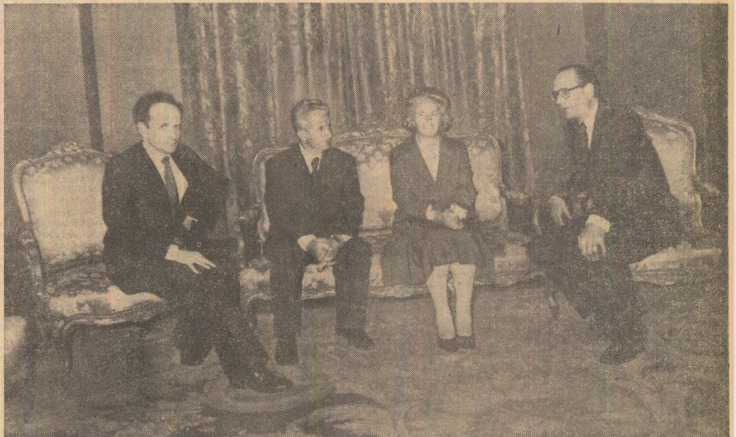
Oaspeți ai Primăriei Parisului