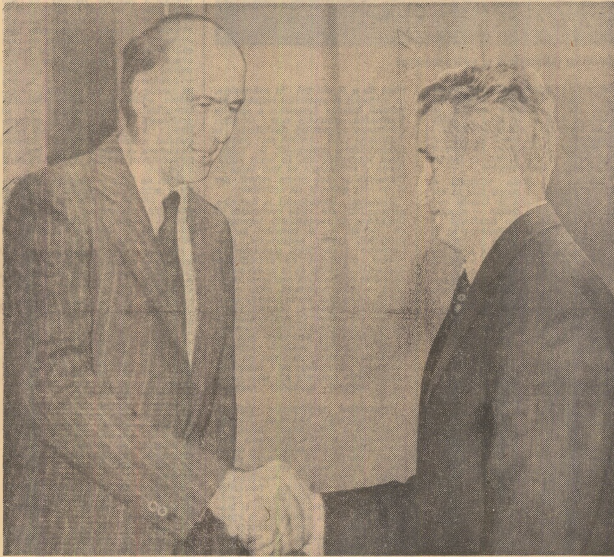
ÎN PAGINILE 2-3:

Convorbirile se desfășoară în spiritul stimel, încrederii și înțelegerii reciproce, într-o atmosferă cordială, prietenească, al dorinței comune de a promova colaborarea între cele două țări, precum și conlucrarea pe plan internațional.