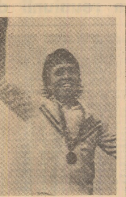
Canoisții de aur

de 2509 oficiali (din partea C.I.O. și a federațiilor sportive internaționale), de 1311 arbitri și circa 3 000 de ziaris- ti.