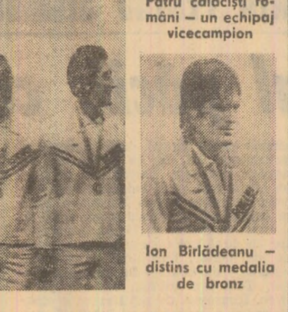
Patru canoistiști români - un echipaj vicecampion