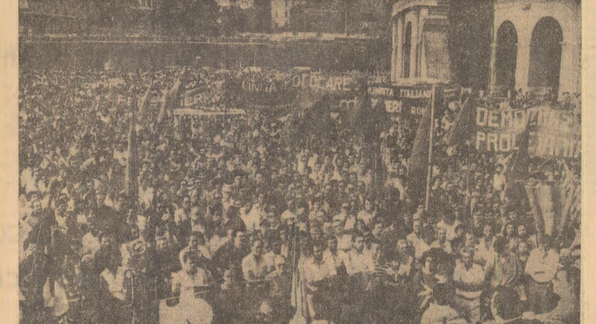
Aspect din timpul amplei demonstrații de protest împotriva terorismului, desfășurate ieri la Roma.