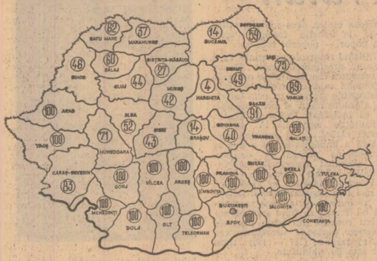
Stadiul recoltării grîului la 7 august

coltarea. Or, secerîșul nu poate fi considerat unitate decât atunci cînd fiecare unitate agricolă s-a achitat integral de sarcinile contractuale față de stat. Livrarea înleagră a cantităților de produse contractate cu statul nu constituie o sarcină facultativă, ci o obligație de mare răspundere, o încălcare a contractului patologic pentru fiecare unitate agricolă, care trebuie îndeplinită exemplar!