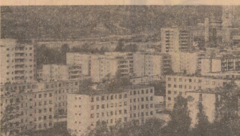
În vecinătatea minel Livezeni, un nou cartier al municipiului Petrosani; în urmă cu două-trei decenii — o luncă a Jiului, cu mărcinișuri.