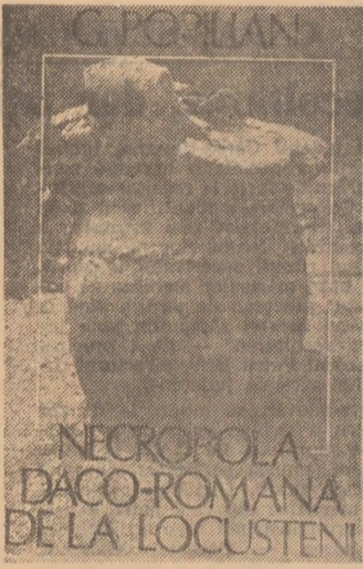
heologia românească le-a adus în ultima vreme la rezolvarea principalelor probleme ale procesului de formare a poporului român.

dacii liberi, la care se adăuga puternică influență romană. În lumina mărturiilor arheologice de la Locusteni, ca și a celor cunoscute anterior, se poate afirma și demonstra că populația dacică a reprezentat etnic de bază al provinciei romane, deși nu exclude o contribuție colonizată venită în Dacia după cucerire. Populația dacică majoritară apare răspândită în mod egal pe întreg teritoriul stăpinit de romani, asigurând treptat să pătrundă în mediul orășnesc, ca și în așezările din preajma castrorilor militare. Aceleași dovezi arheologice arată în mod direct și cu toată limpezime că populația dacică din provincie a primit tratat latin și unele elemente de civilizație romană, acționând astfel în evidență diferitele faze ale procesului de romanizare. Lucrarea lui G. Popilian se înscrie, prin valoarea sa documentară și științifică deosebită, în rândul importanților contribuții pe care ar-