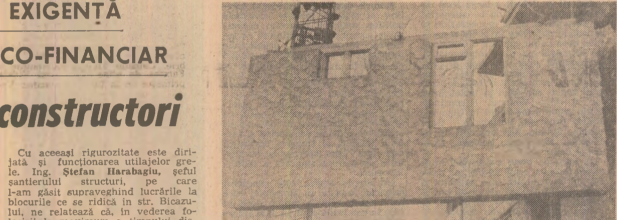
Panouri prefabricate cu un înalt grad de finisare, realizate în secția de producție industrială a trustului