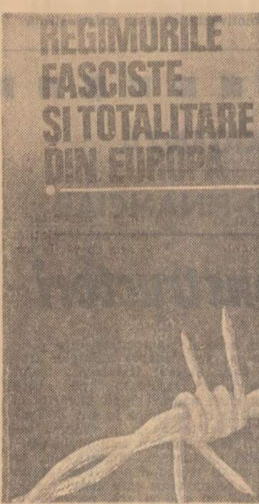
perioada 1941-1944, se evidențiază statornicia, susținutele eforturi ale P.C.R. pentru unirea tuturor forțelor patriotice și progresiste în lupta împotriva dictaturii militare fasciste.

Autorii dezvoltă caracterul totalitar al statelor fasciste, sistemele politice, aparatul repressiv, organizarea corporatistă, subliniind că teoretic, convingerile, propaganda deșănțată au fost ridicate la rangul de politică de stat, sublinindu-se însă că nicăieri ele n-au atins proporțiile din Germania. Se relevă totodată faptul că în această țară pregătirea războaielor pentru dominația mondială a început odată cu instaurarea dictaturii naziste, visuri hrăpărețe nutrit deopotrivă și fascistii italieni, și Ungaria horthystă care și-a legat speranțele revizioniste de politica agresivă a puterilor Axei. Un amplu studiu este consacrat mișcării fasciste în România, care nu a putut veni la putere decât în 1940 în condițiile cînd pe plan internațional raportul de forțe era favorabil statelor fasciste, revizioniste și agresive. Întinzând factorii care au generat fascismul și l-au dus la suprafața vieții politice a țării, autorii arată că la noi curentele și organizațiile fasciste au fost în esență rezultatul eforturilor cercurilor externe, ale burgheziei imperialiste de a-și realiza avanposturi în țările vizate a constitui obiect al revizuirilor teritoriale. De aceea, fascismul românesc a apărut în condiții de inferioritate față de fascismul italian și german, fiind repudiat de popor. Urmărindu-se apoi evoluția regimului fascist în perioada septembrie 1940—ianuarie 1941 și în