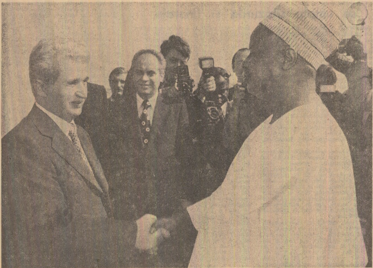
Călduroase stringeri de mină la plecare

La ora 10.30, avionava oficială cu care călătorește președintele Republicii Unite Camerun a decolat.