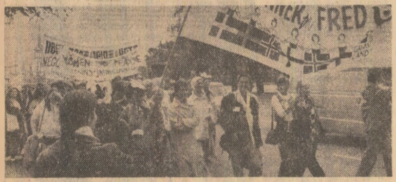
COPENHAGA. Demonstrație pentru pace și destindere, inițiată de organizațiile de femei din Danemarca