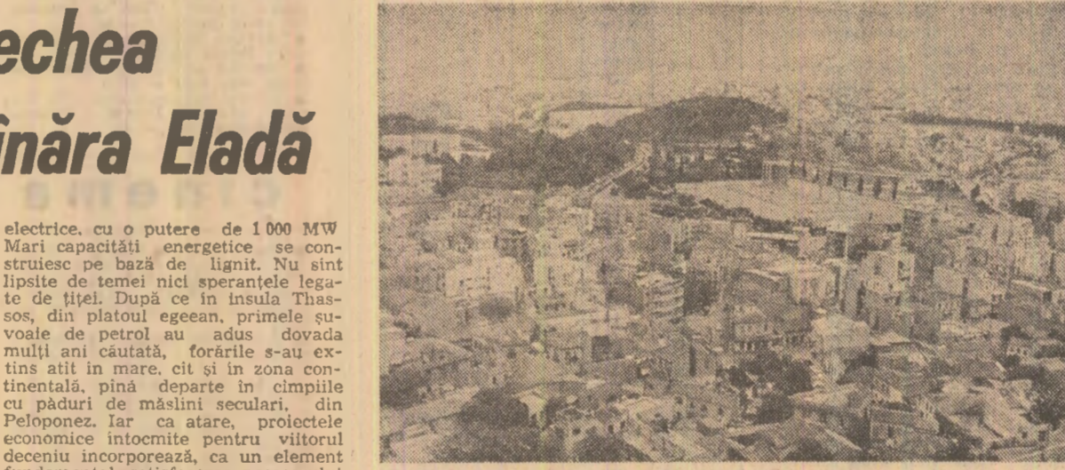
ATENA. Vedere panoramică