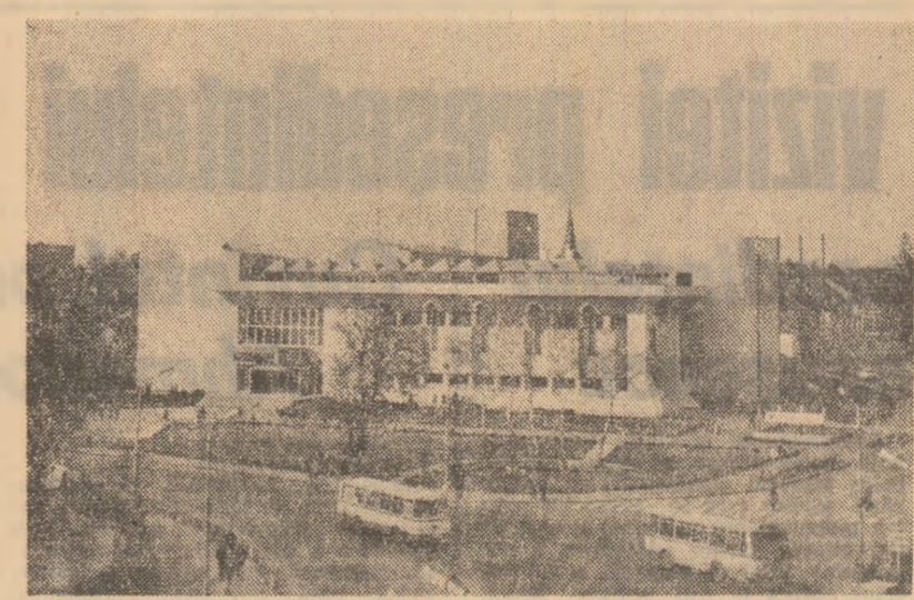
Sibiu: Casa de cultură

LUNI, 1 SEPTEMBRIE PROGRAMUL 1 15.30 Emisiune în limba maghiară 18.30 Libia. Reportaj 19.00 1001 de seri