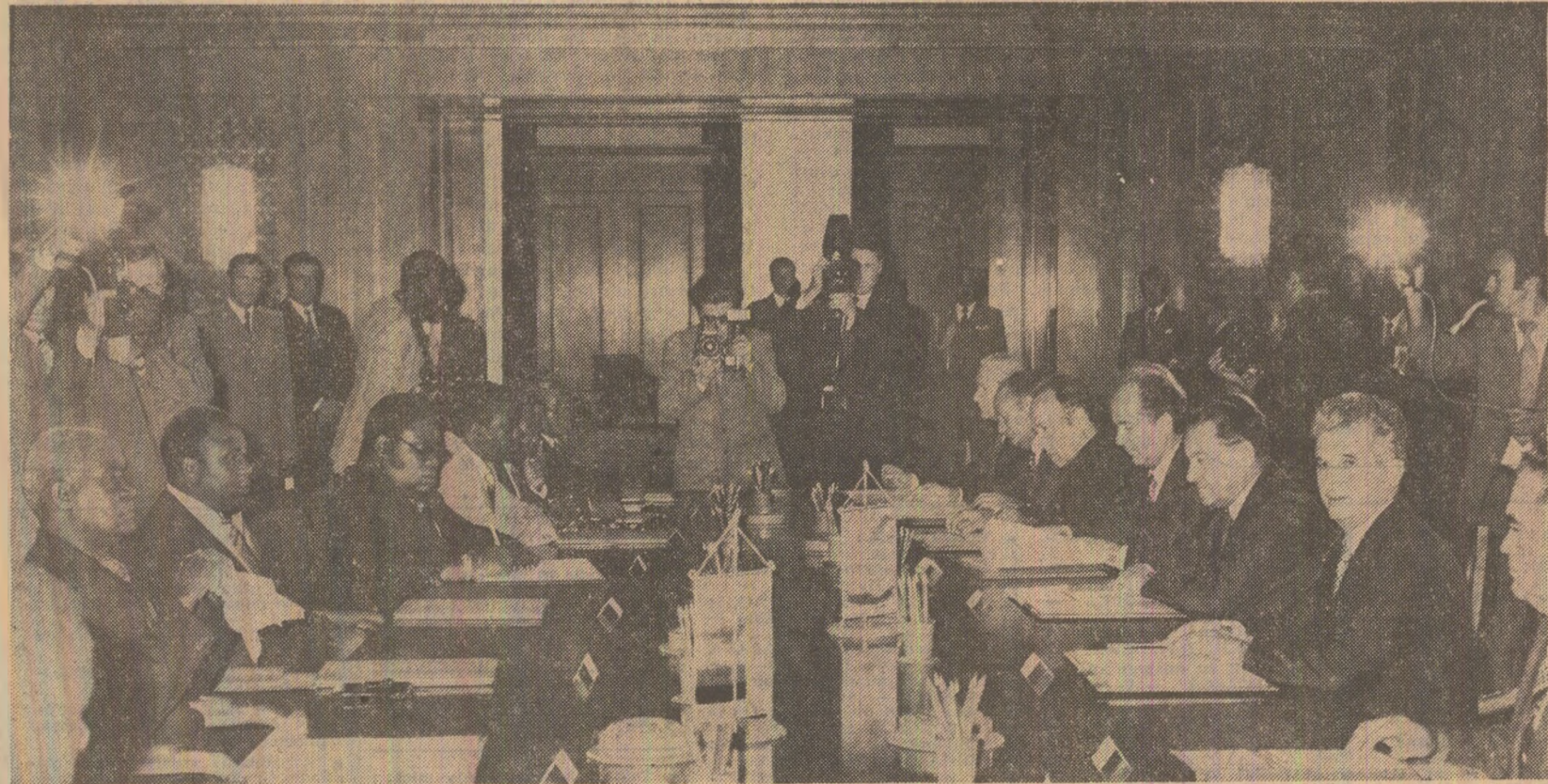
În timpul convorbirilor oficiale