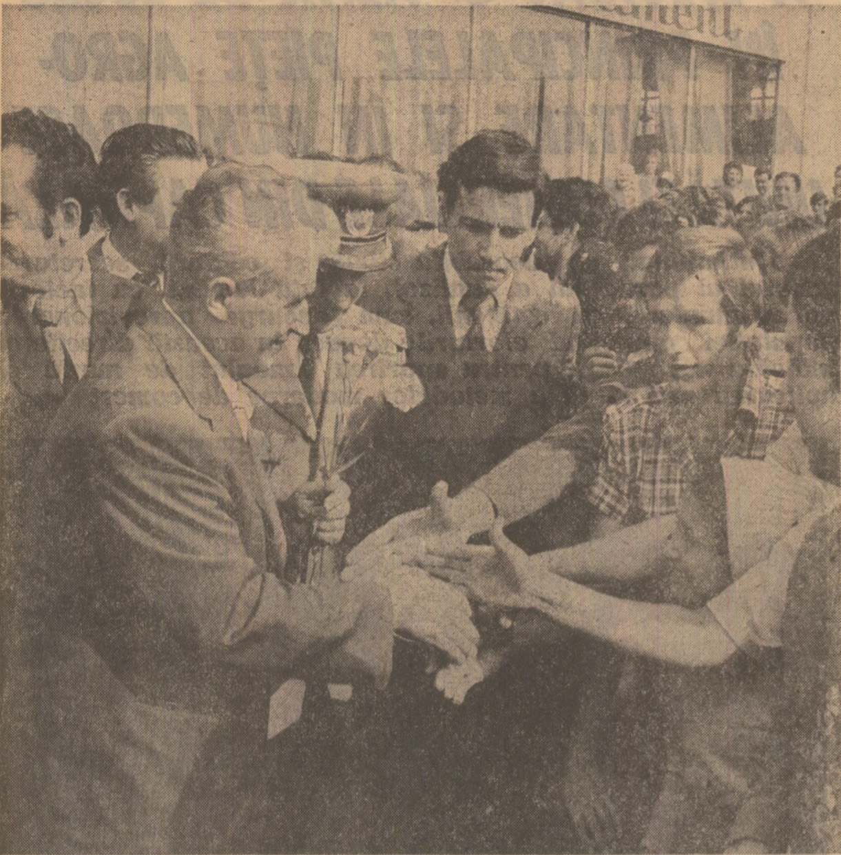
(Urmare din pag. 1)