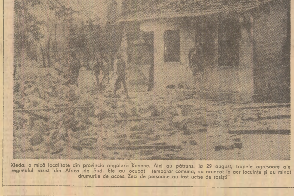
Xieda, o mică localitate din provincia angoleză Kunene. Aici au pătruns, la 29 august, trupele agresoare ale regimului rasist din Africa de Sud. Ele au ocupat temporar comuna, au răscolit drumurile de acces, Zeci de persoane au fost ucise de rasisti