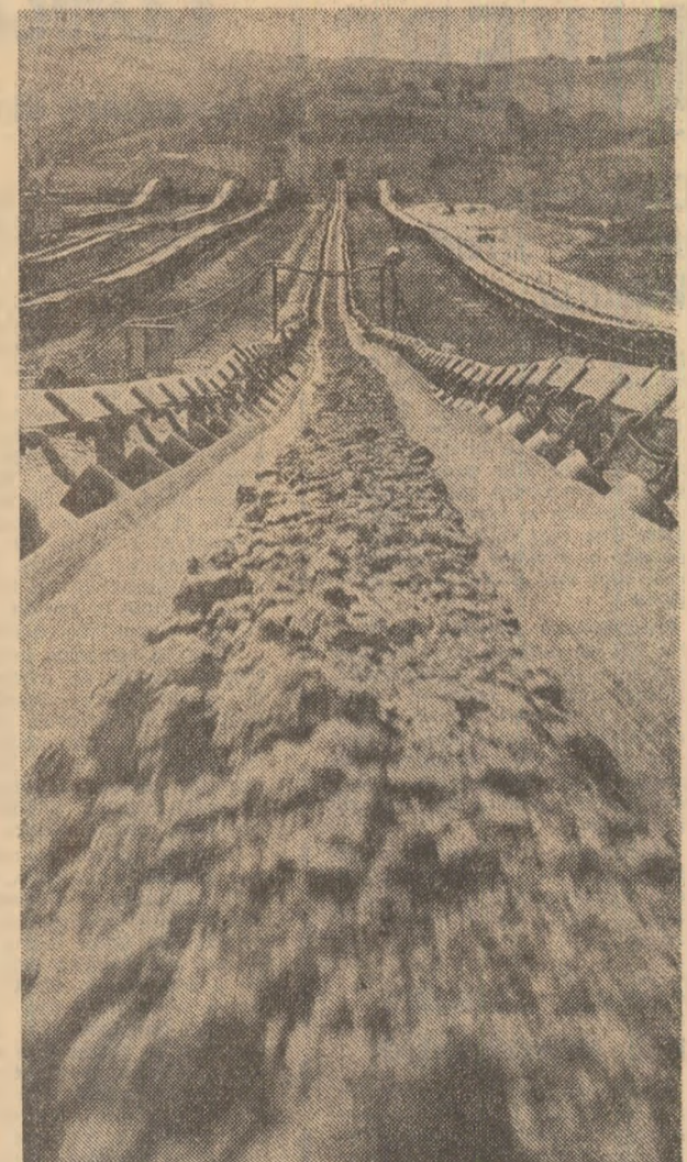
Pe banda de transport suvoilor de cărbune din cariera Lupoia se îndreaptă spre silozuri — scurt popos în drumul către termocentrala Ișalnița

ORA 8: Potrivit programului, la excavatoarele 01, 02, 04 s-a încheiat revizia zilnică. Se repetă de cîteva ori la microfon un anunț important: „Feriți benzile! Totul e în ordine. Pornim. Rotorul excavatorului 01 începe să se învîrtească. Știm că acest cărbune va ajunge de curînd la ter-