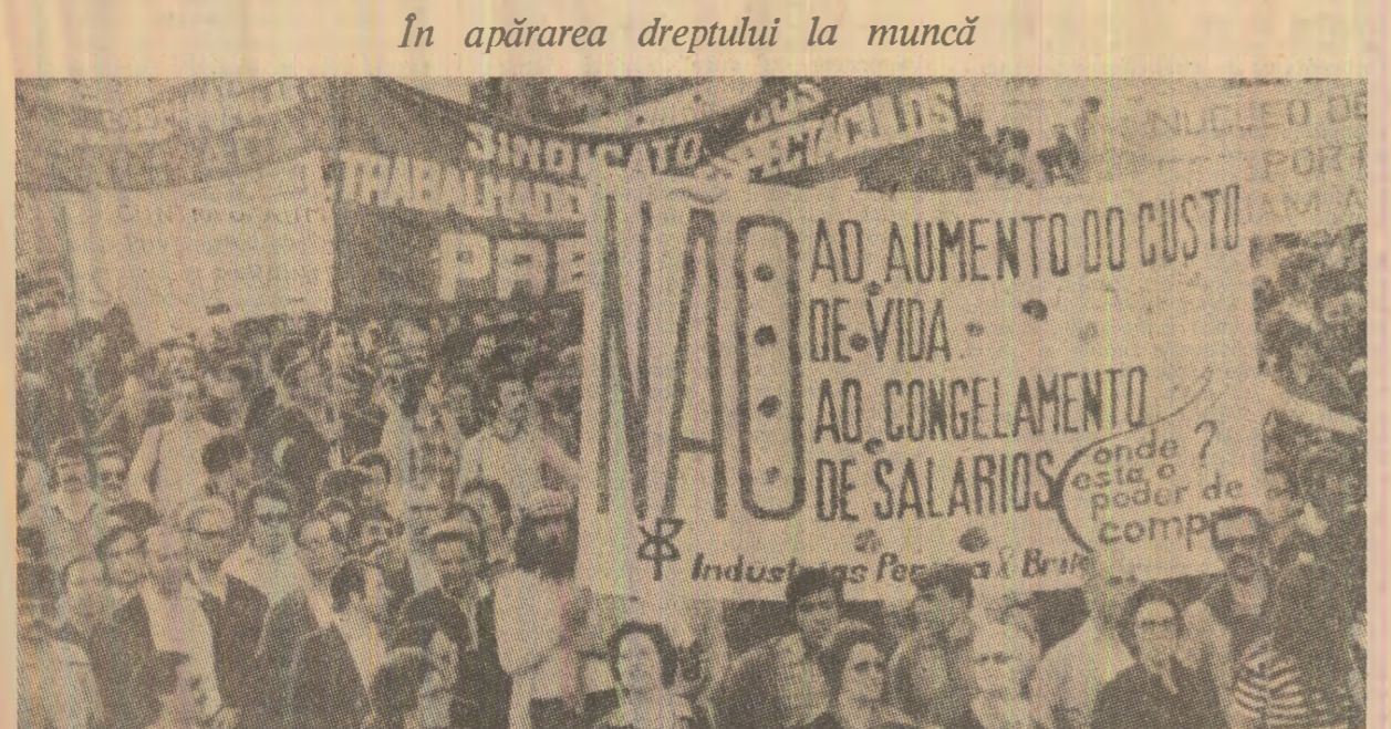
În apărarea dreptului la muncă. În diferite țări occidentale se desfășoară ample acțiuni muncitorești pentru asigurarea locurilor de muncă, în genere împotriva măsurilor companiilor internaționale care lovesc în nivelul de trai al celor ce muncesc. În fotografie: aspect din timpul unei demonstrații desfășurate recent în orașul Porto (Portugalia)

ABU DHABI 18 (Agerpres). — Emiratul Arabe Unite și Senegalul au cerut retragerea Israelului din teritoriile arabe ocupate și restabilirea drepturilor inalienabile ale poporului palestinian, inclusiv a dreptului său la autodeterminare.