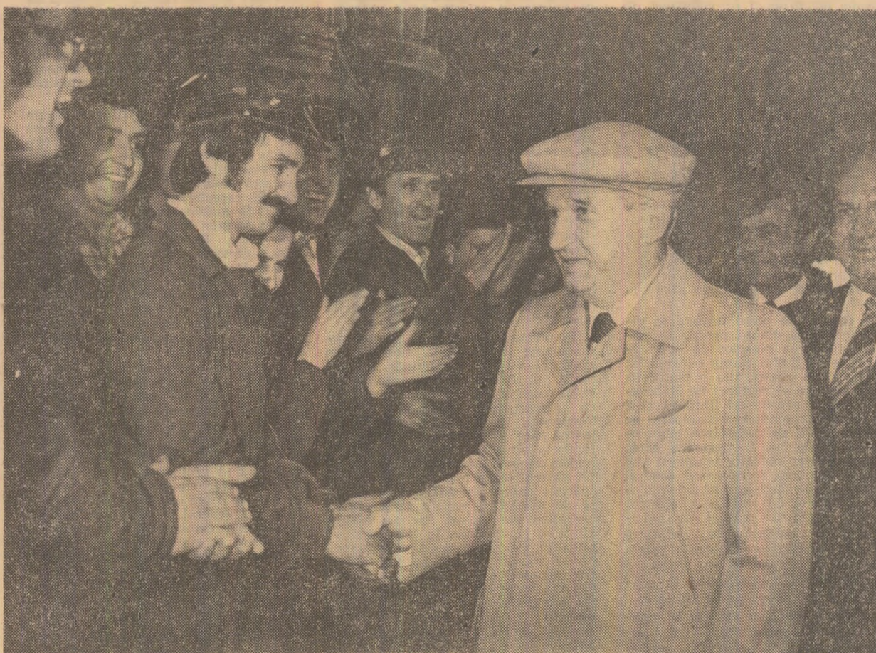
Muncitorești stringeri de mină la întreprinderea mecanică Roman

Marea adunare populară din municipiul Piatra Neamț Relatarea în pagina a IV-a