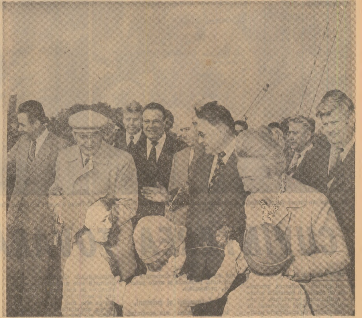
Flori ale dragostei și recunoștinței