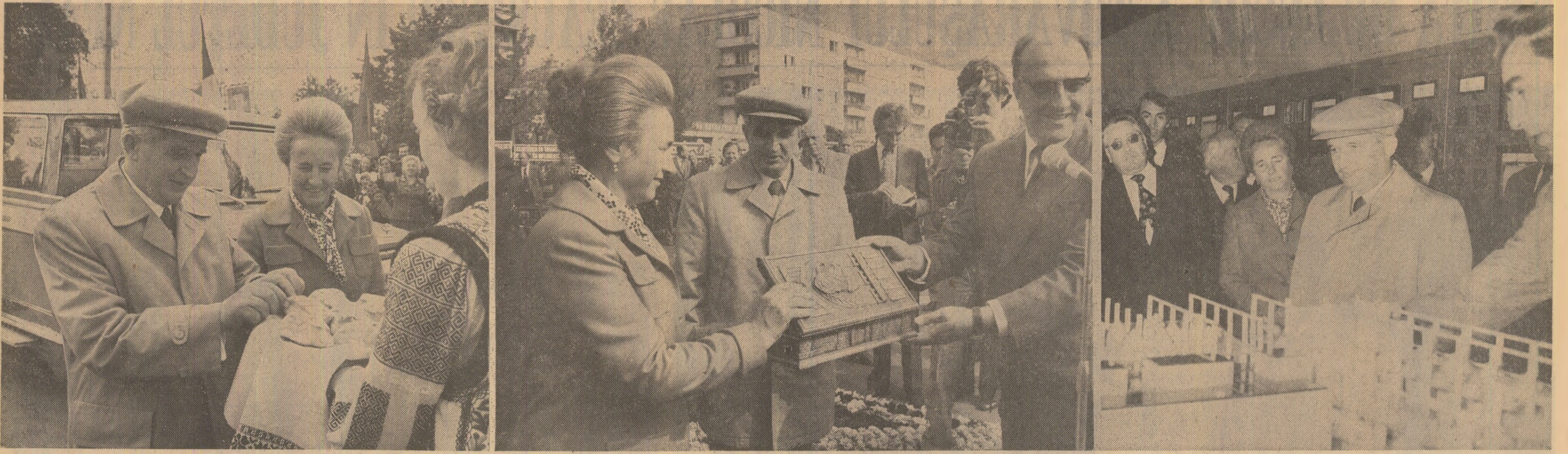
Momente din timpul vizitei: primire după datina străbună la întreprinderea „Ceahlăul” Piatra Neamț; înmînarea cheii orașului, a plachetei și insignei ce constituie însemnele jubileului cetății Petrodava; dialog fructuos la întreprinderea de fire și fibre poliamidice din Roman