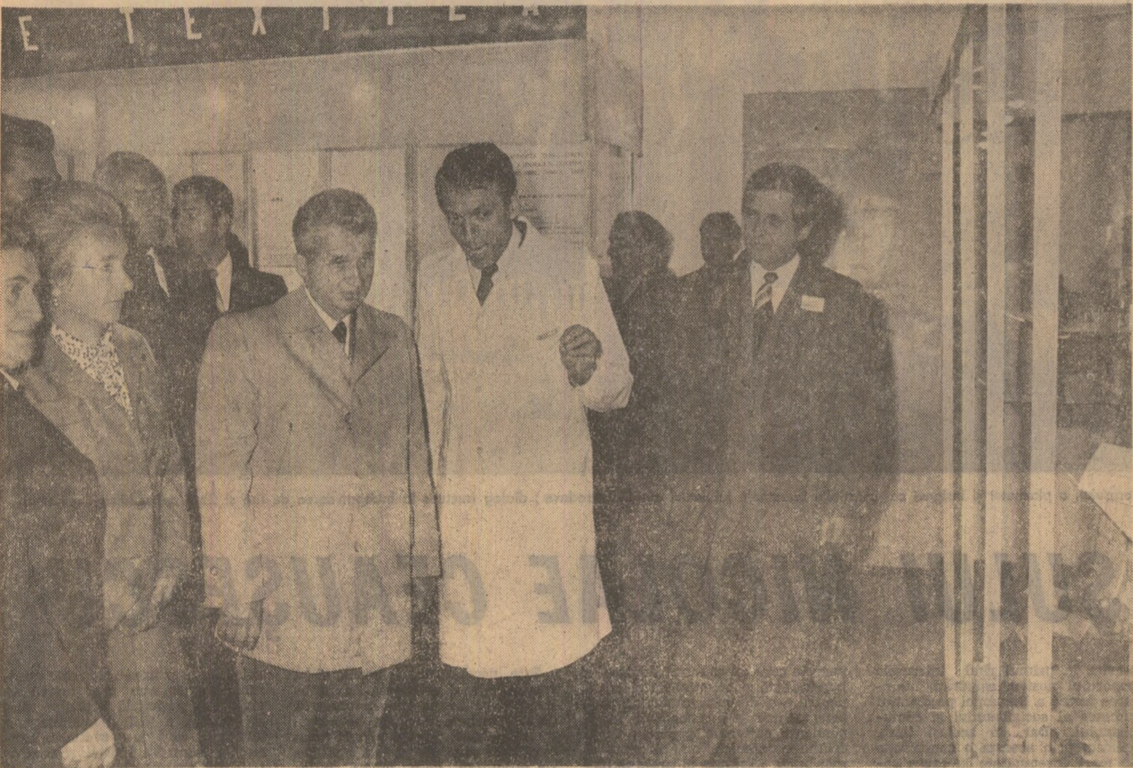
În timpul vizitei la Combinatul de fibre sintetice Săvinești