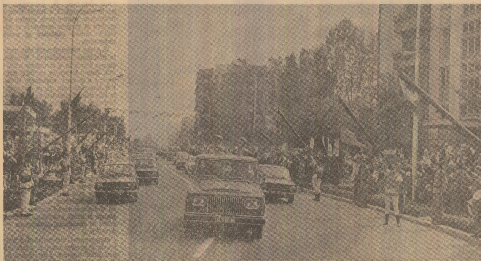
Primire căldă, entuziastă, pe străzile municipiului Piatra Neamț