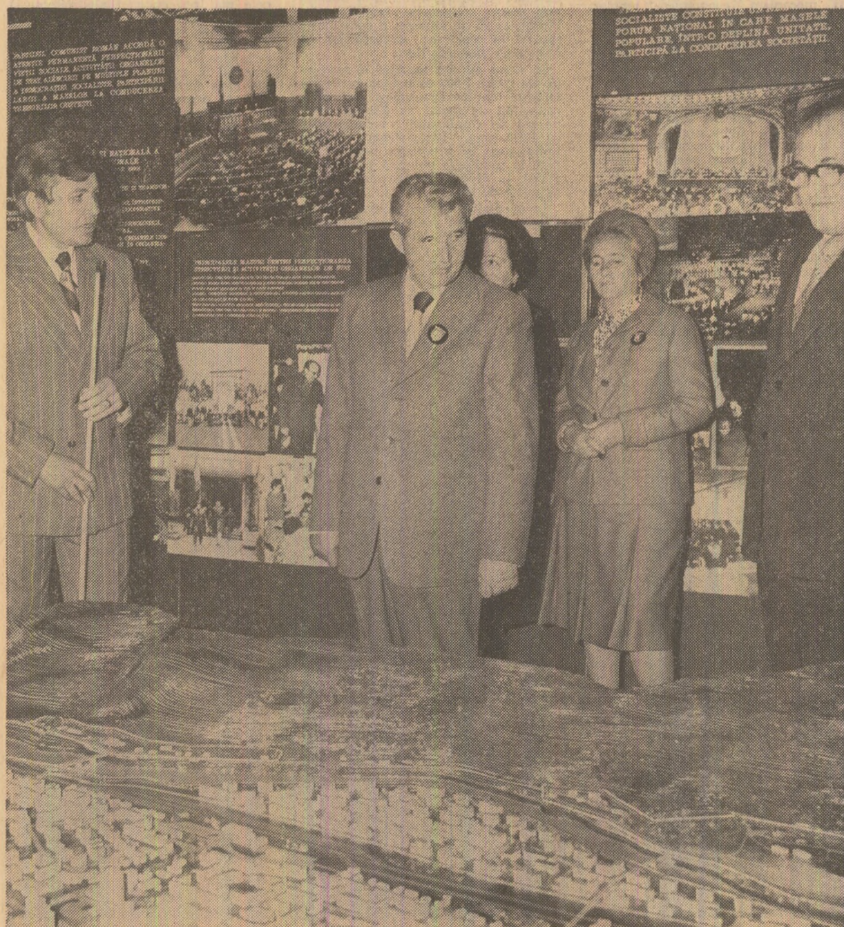
La Muzeul de Istorie din Piatra Neamț

Vă urez din toată inima succese tot mai mari în întreaga activitate, multă sănătate și multă fericire! (Aplauze și urale puternice, îndelungate; se scandează minute în șir „Ceașescu — P.C.R.”, „Ceașescu și poporul!”). Într-o atmosferă de vibrant patriotisme, de puternică unitate, toți cei prezenți la marea adunare populară ovaționează cu însuflețire pentru Partidul Comunist Român, pentru Republica Socialistă România, pentru secretarul general al partidului și președintele țării, tovarășul Nicolae Ceașescu.