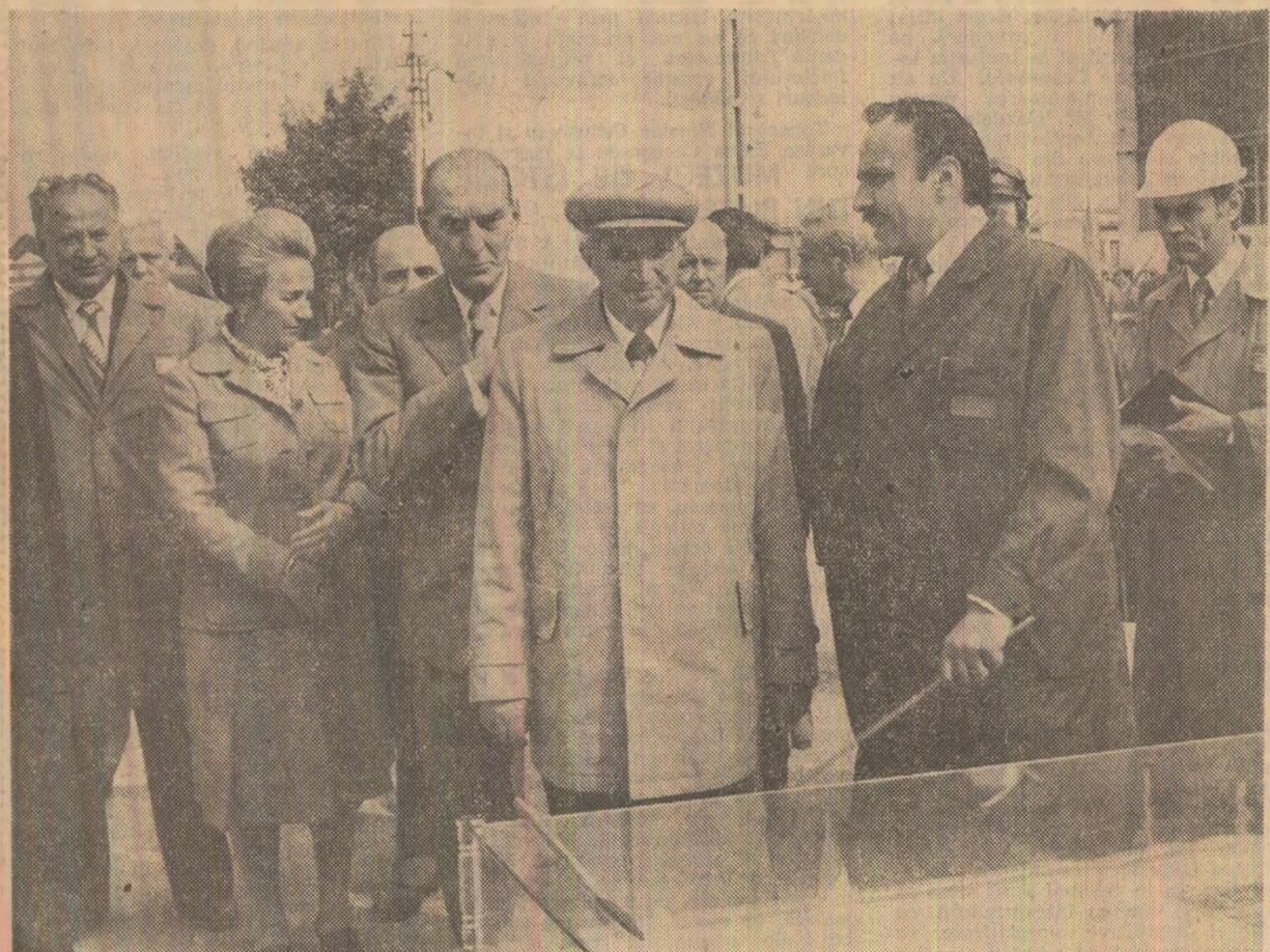
La „Ceahlăul” Piatra Neamț se discută despre modernizarea produselor întreprinderii

locuitorilor de pe aceste meleaguri, din Moldova, din România în general, de pe teritoriul actual al patriei noastre, pentru dezvoltarea și formarea poporului român, pentru independența națională, pentru construcția socialismului. Adresez felicitări organizatorilor acestui muzeu! (Aplauze și urale puternice, prelungite; se scandează „Ceaușescu — pace!”). În toate întreprinderile și combinatele pe care le-am vizitat am discutat cu oamenii muncii, cu cadrele de conducere, consiliile oamenilor muncii, organizațiile de partid, atît despre ceea ce s-a realizat, dar, mai cu seamă, despre ceea ce trebuie făcut pentru ridicarea nivelului întregii activități, corespunzător cerințelor puse de Congresul al XII-lea al partidului privind realizarea unei noi calități. Oamenii muncii cu care am discutat, conducerea întreprinderilor și-au luat angajamentul și au dat asigurarea că vor face totul ca, în viitor, aceste întreprinderi — și sînt convins că aceasta corespunde dorinței tuturor oamenilor muncii din județul Neamț și din municipiul Piatra Neamț — să obțină rezultate și mai bune, să încheie actualul cincinal pe un loc cit mai