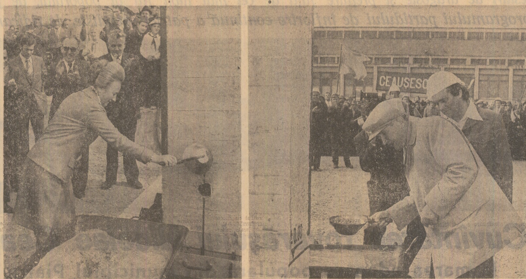
Moment de cîntărit a unui nou laminor de tevi la Roman

Pe stadion domnește o atmosferă de vibrant entuziasm.