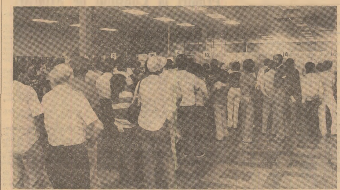
Agencia France Presse transmite, într-un comentariu consacrat ultimelor evoluții din economia americană, că în cel de-al treilea trimestru al acestui an produsul național brut nu va crește deloc, după ce, în cursul trimestrelor precedent, înregistrase o diminuare de 9,7 la sută - una din cele mai drastice reduceri din ultimii ani.

Una din ramurile industriale cel mai puternic lovite de efectele crizei economice este cea a construcțiilor de automobile. La Detroit - oraș supranumit „capitala industriei americane a automobilului” - fiecare al patrulea adult (ceea ce înseamnă peste 120.000 persoane) este fără lucru, fapt care face ca biroul de plasare a forței de muncă de pe Michigan Avenue (în fotografie) să fie zilnic suprasolicitat.