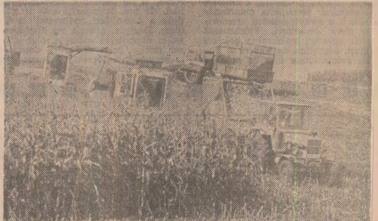
La C.A.P. Zau de Cimpia, județul Mureș, se recoltează porumbul.

Silvestri AILENEI corespondentul „Scînteii”