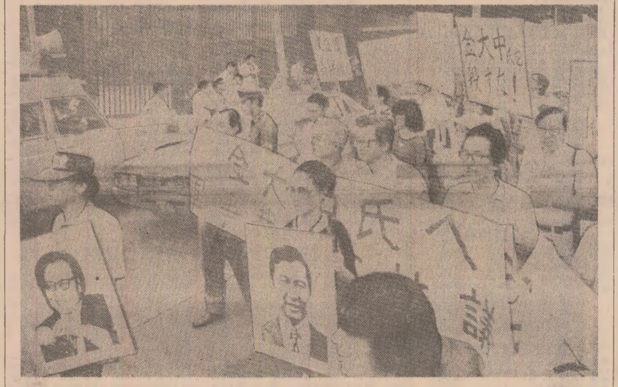
Condamnarea la moarte a militonului democrat Kim Dae Jung, ca și alte sentințe date la înscenările judiciare din Coreea de Sud împotriva unor patrioți au trezit indignare și în Japonia. In fotografie: Demonstrație de protest la Tokio