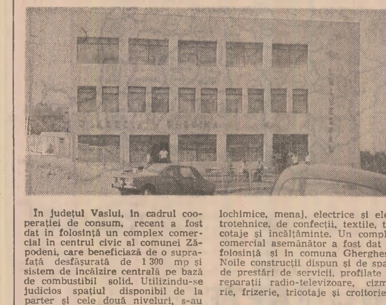
În fotografie: noul complex comercial din comuna Zăpodeni