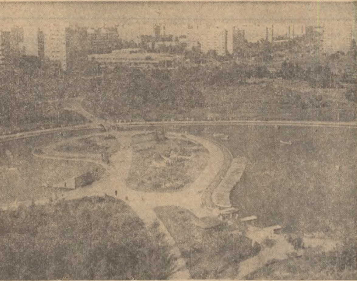
O nestemată mai nouă în saiba de parcuri și lacuri ce împodobesc Capitala: parcul din cartierul Drumul Taberei.