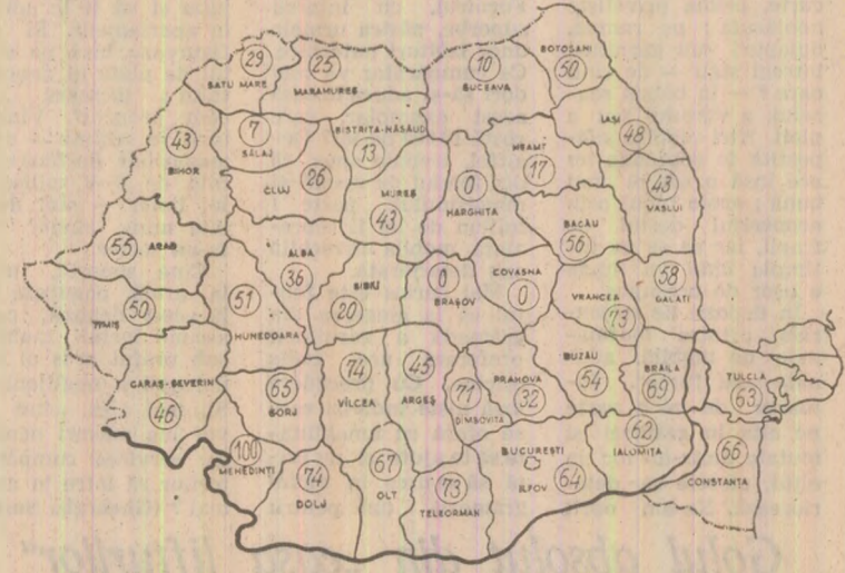
Stadiul recoltării porumbului (în procente) în cooperativele agricole, la data de 21 octombrie

Grăbirea lucrărilor de recoltare nu trebuie să ducă la risipă. După cum se știe, în cursul zilei de luni, tovarășul Nicolae Ceaușescu a exa-