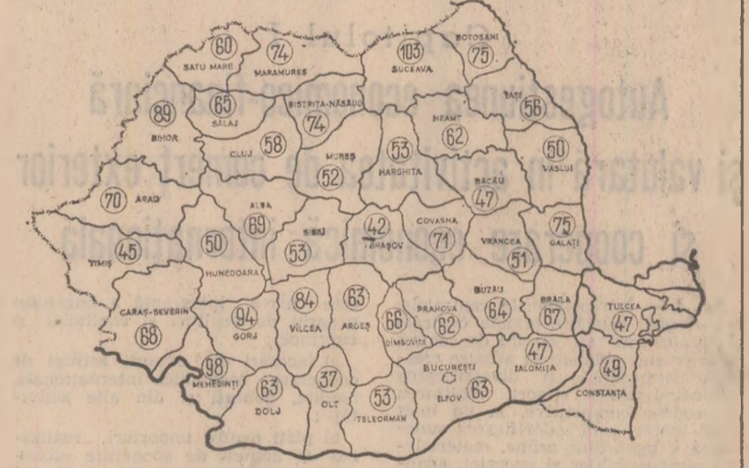
Stadiul însușirii furajelor în cooperativele agricole la data de 30 octombrie