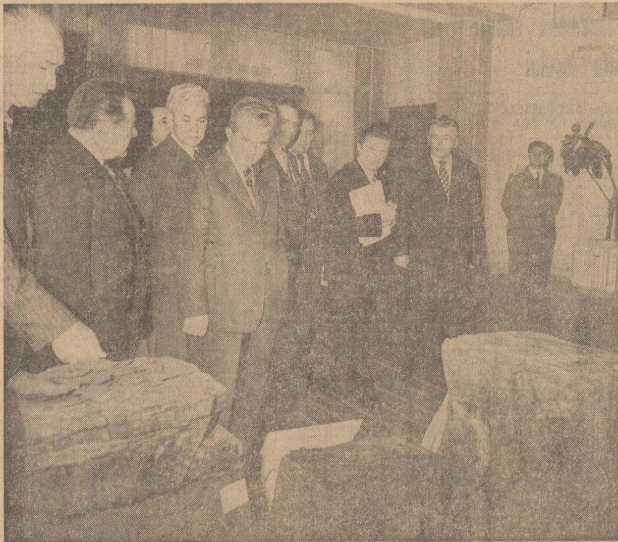
În timpul vizitării expoziției