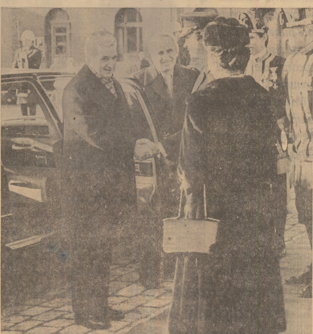
Un cordial bun venit