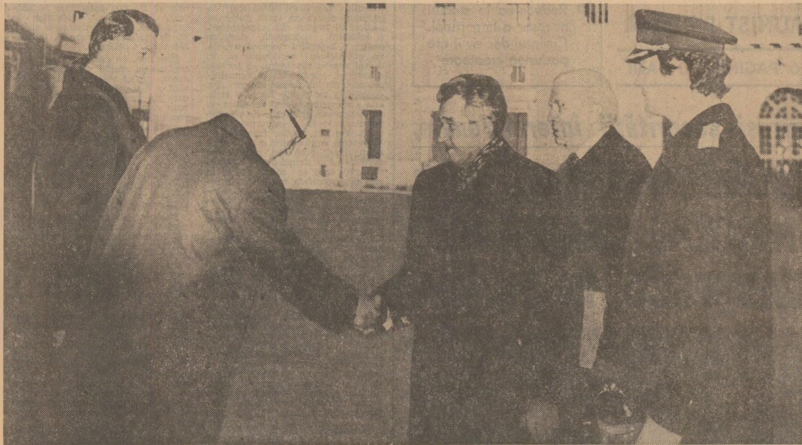
Personalități de frunte ale Suediei aduc omagiul lor președintelui României