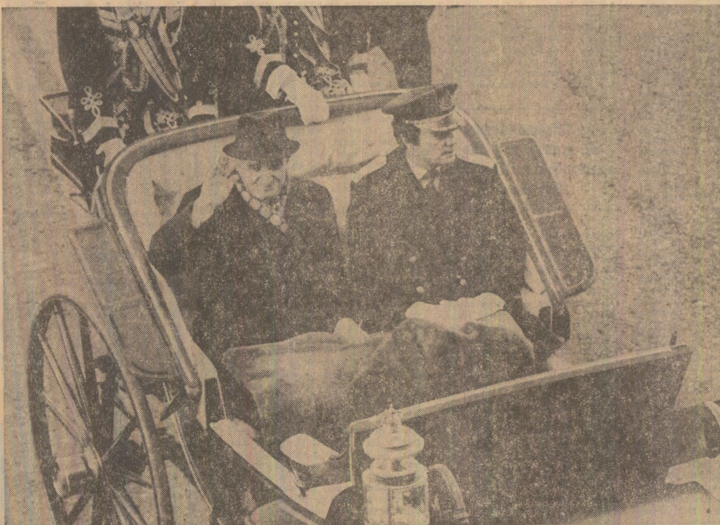
În drum spre Palatul Regal