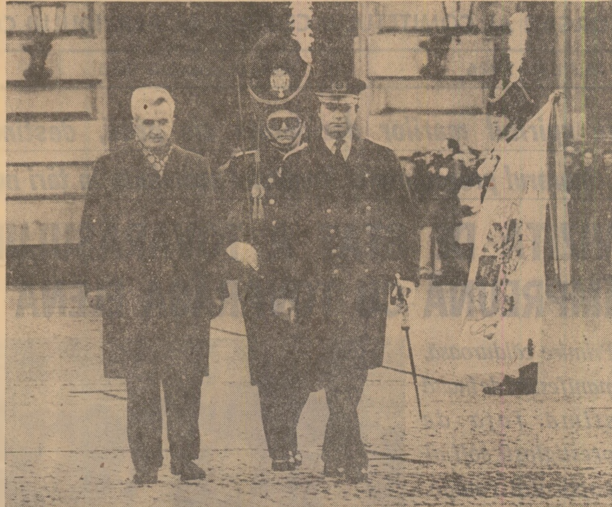
Se trece în revistă garda de onoare