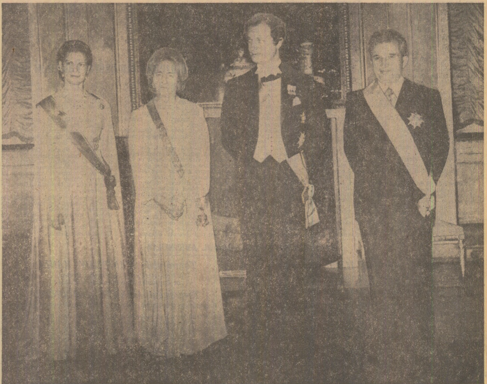
La dineul oficial