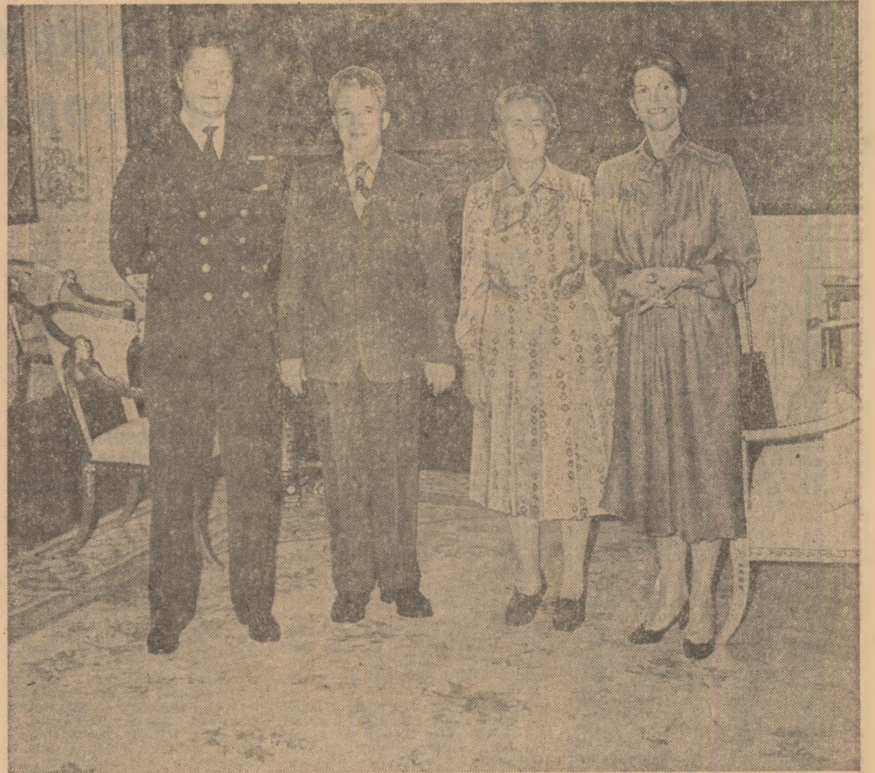
Moment din timpul vizitei, desfășurată sub auspiciile stimei reciproce, ale dorinței sincere de colaborare multilaterală, în interesul celor două popoare