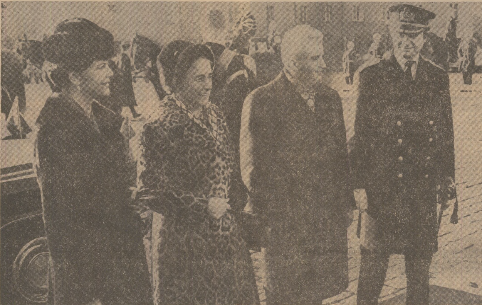
Solii României întâmpinați cu cordialitate în Piața Muzeului Militar

Primire călduroasă, manifestări de înaltă stimă față de prestigiosii soli ai poporului român, ambianță cordială — expresii elocvente ale bunelor relații prietenești româno-suedeze, ale voinței comune de a conferi dimensiuni mai ample colaborării pe multiple planuri dintre cele două țări și popoare