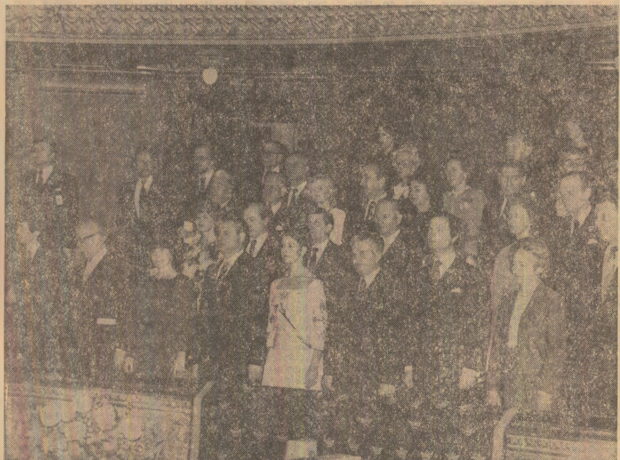
Aspect de la spectacolul de gală