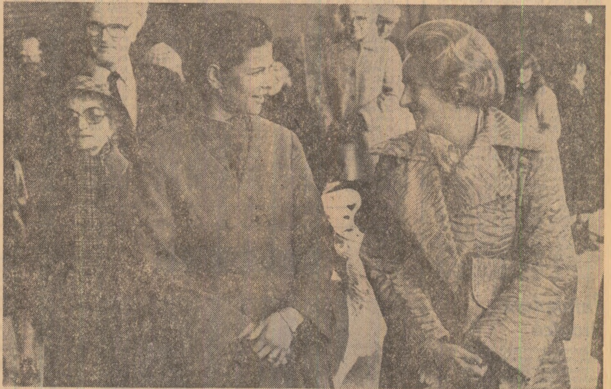
Permanent, ambianță de cordialitate

Totodată, referindu-se la stadiul actual al schimburilor comerciale dintre cele două țări, se exprimă speranța că vizita sefului statului român în Suedia va contribui la dezvoltarea raporturilor economice bilaterale.