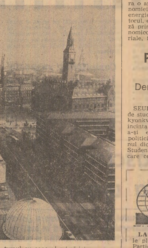
În centrul orașului Copenhaga, turnul cu ceas al primăriei

turnării automate a pieselor din fontă. Turnătorie automată, acesta ar fi termenul mai exact. O mașină care face automat și cu un randament incredibil tot ce se face într-o turnătorie clasică. O singură asemenea mașină poate să toarne într-o oră (pregătind automat și formele necesare) până la 300 de piese, cum ar fi blocul motor pentru automobile. 90 la sută din automobile care circulă azi în lume au blocuri motor turnate cu mașini „Disamat”, 25 de asemenea mașini pot asigura blocurile motor pentru întreaga producție mondială de automobile. Trei mașini „Disamat” se află și în România și se pare că una dintre ele este chiar foarte bine folosită la Vlahița, boarnă carcase pentru motoare electrice. Și atât, ni se oferă și un mic spectacol: simularea funcționării unei asemenea mașini (un exemplar aflat la testare și destinat, se pare, firmei franceze „Renault”). Cei doi muncitori de lângă ea apasă pe un buton, mașina se punge în mișcare și, formidabil, într-adevăr, dar dintr-o dată, se oprește; un semnal de alarmă... A nu, nu s-a întâmplat nimic, cei doi au simulat o defecțiune. În asemenea cazuri mașina se oprește și automat este indicat locul avariei... Cei doi