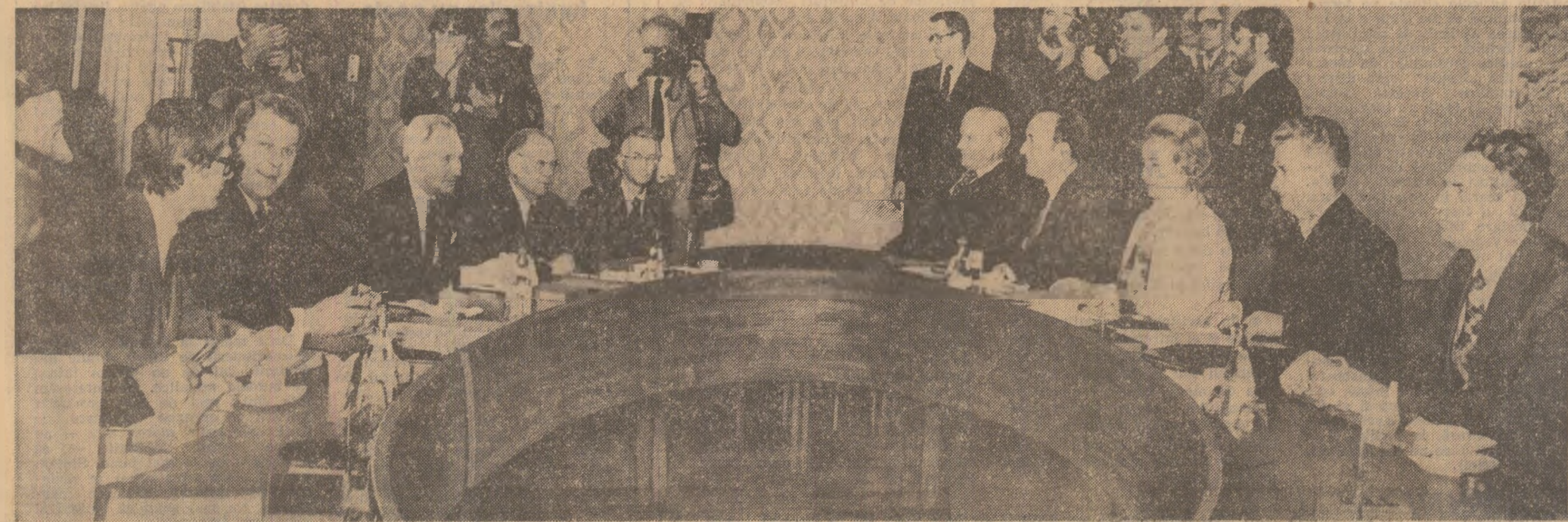
La începerea convorbirilor oficiale

Dialogul la nivel înalt evidențiază posibilitățile largi de extindere a cooperării în importante domenii de activitate și relevă voința de fructificare a acestor posibilități în folosul ambelor țări, al progresului economic, al destinderii și păcii în Europa și în lume