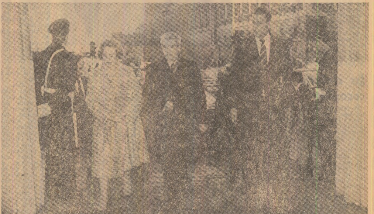
Sosirea la președinția Consiliului de Miniștri