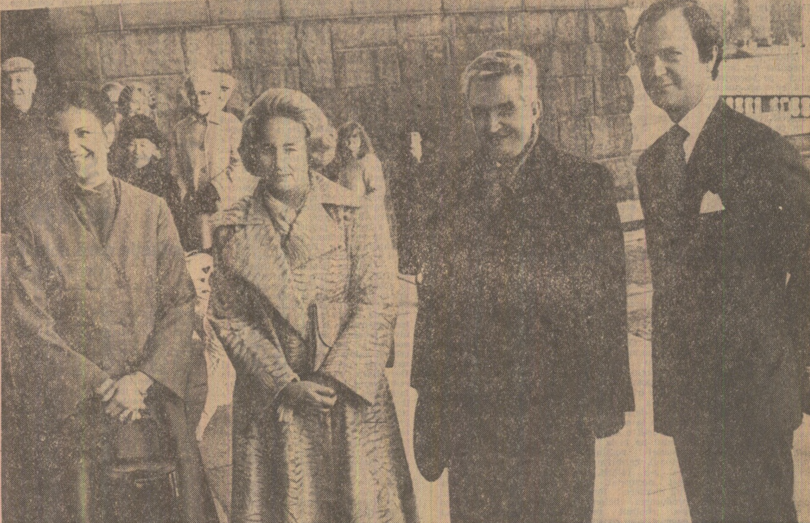
După dejunul de la primăria Stockholmului

La sfîrșitul dejunului, desfășurat într-o atmosferă de cordialitate, tovarășul Nicolae Ceaușescu și tovarășa Elena Ceaușescu s-au fotografiat împreună cu Maestăștii Lor regele Carl al XVI-lea Gustaf și regina Silvia.