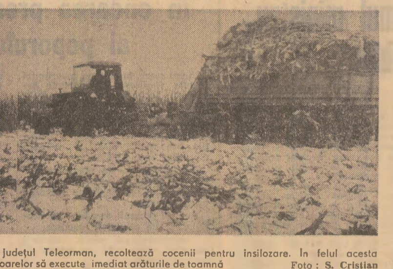
În ciuda zăpezii, mecanizatorii de la C.A.P. „Cetea” Turnu Măgurele, județul Teleorman, recoltează cocenii pentru insulozarea. În felul acesta ei grăbesc eliberarea terenului și permit tractoarelor să execute imediat arăturile de toamnă.