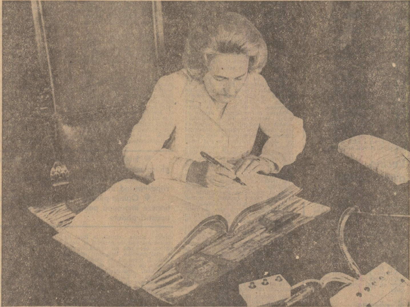
Se semează în Cartea de onoare a municipalității Stockholmului