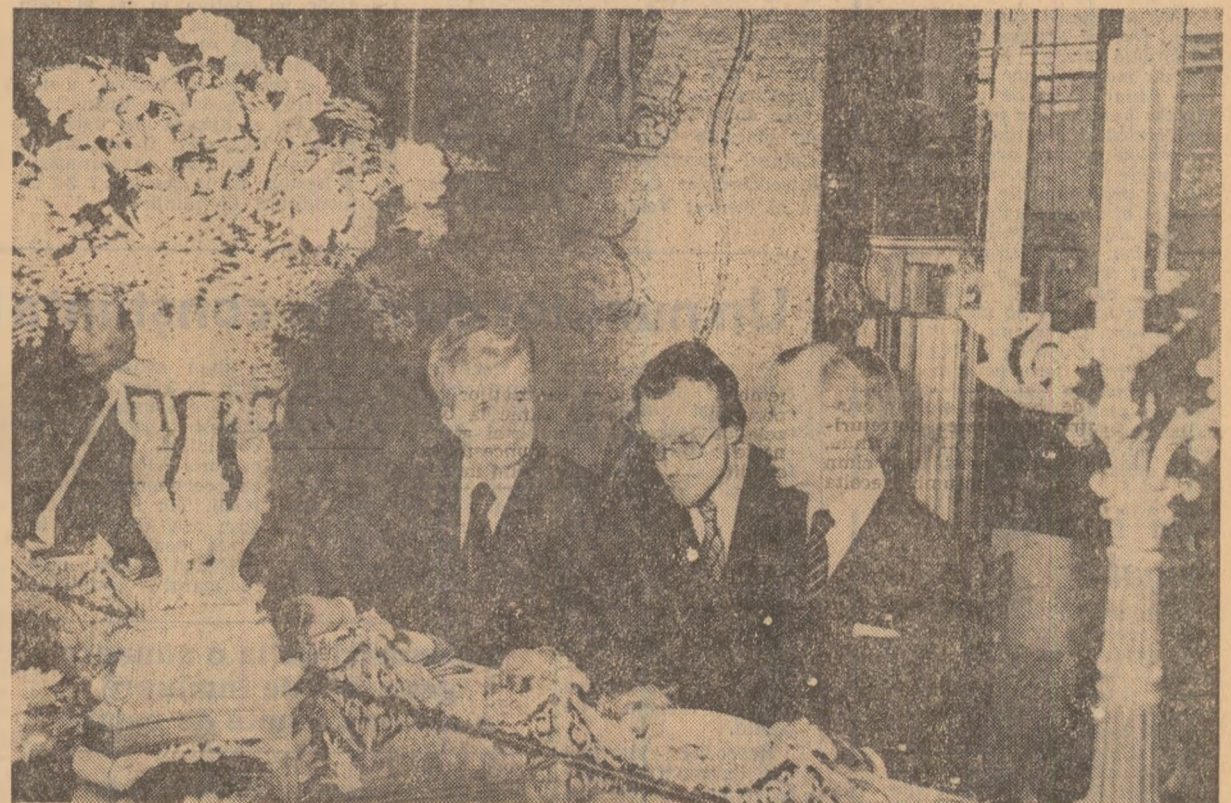
În timpul vizitei la primărie

Convorbirile s-au desfășurat într-o atmosferă prietenească, de stimă și înțelegere reciprocă.