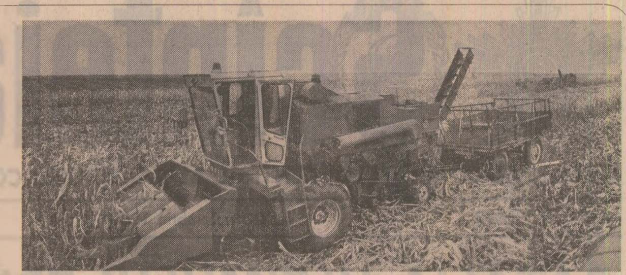
În ultimele zile, odată cu zvîntarea lunilor, în unele unități agricole din județul Teleorman, a fost reluată recoltarea mecanizată a porumbului.

Pe parcelele zvîntate aparținînd cooperativei agricole din Cărbîni, Ieșea, Marș, Jimbolia, Lenuaheim, Varias, situate în zona de cernoziom a județului, și-au reluat intens activitatea combinate de recoltat, astfel încît suprafețele ocupate cu sfecă de zahăr s-au diminuat simțitor, reprezentînd acum 25—30 la sută din cele cultivate. În alte unități unde nu se poate recolta mecanizat au ieșit la cules sute de cooperatori și alți lucrători ai satelor. La cooperativă din Ceneș și Checea, unități mari cultivatoare de sfecă de zahăr, se aflau marti la lucru peste 500 de oameni. Și la C.A.P. Biled, care mai are de recolat aproape jumătate din suprafața cultivată cu sfecă de zahăr, s-au organizat, începînd din această săptămînă, echipe de cooperatori. Dar în județul unități unde se înregistrează o slabă participare la recoltat alți din partea cooperativei, cit și a mecanizatorilor. Se invocă mereu urmările timpului nefavorabil, desi de cîteva zile vremea s'a îmbunătățit, iar de marti peste cîmpa timișeană zămbea un soare generos. — Cauza principală o constituie slaba organizare a muncii, proasta întretinere a utilitatilor. Cele 5 combinate de recolat din dotarea S.M.A. Periam, de pildă, nu și-au reluat încă activitatea în cîmp, desi