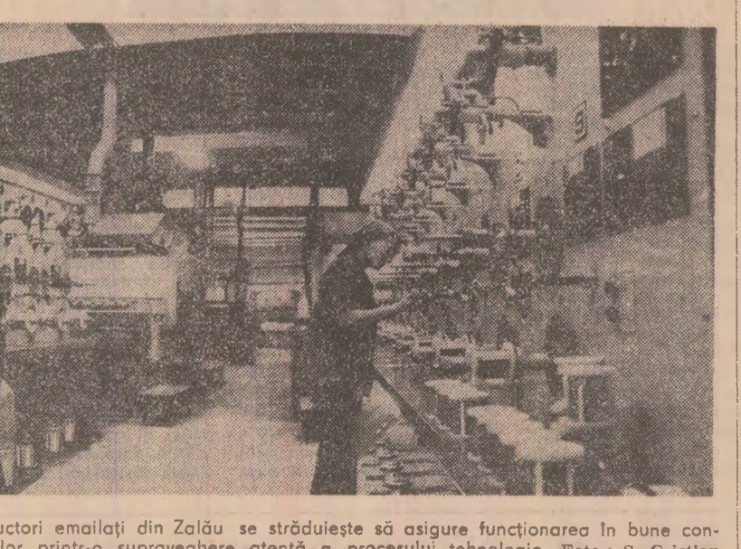
Tindrul colectiv al întreprinderii de conductori emalați din Zalău se străduiește să asigure funcționarea în bune condiții a utilajelor și instalațiilor...