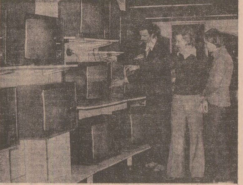
Filme, concerte, piese de teatru, emisiunile de operă, transmisiuni sportive, cururi de limbă străină — toate acestea în limba naționalităților