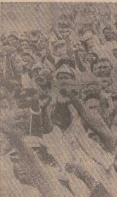
În timp ce autoritățile rasiste de la Pretoria încearcă să-și permanentizeze ocupația asupra Namibiei, instalând aici o administrație marionetă, poporul namibian cere tot mai insistent organizarea de alegeri democratice...

S.W.A.P.O. și R.S.A. și asupra aplicării rezoluțiilor O.N.U. S.W.A.P.O. relevă documentul, condamna manevrele tactice ale regimului rasist sud-african urmărind evitarea unor convorbiri și prin aceasta amânarea aplicării rezoluțiilor O.N.U. privind Namibia. Mișcarea de eliberare națională a poporului namibian denunță intensificarea de către regimul de la Pretoria a acțiunilor represive în Namibia și agresiunile militare împotriva Angoli, asasinarea și încercarea patrioților namibieni, a adeptilor S.W.A.P.O. și a simpatizanților săi, în încercarea de a anihila aspirațiile la libertate și independență reală ale poporului namibian.