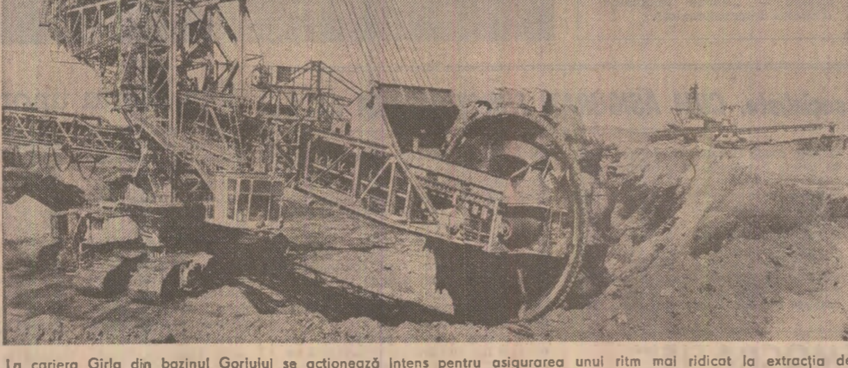
La cariera Gîrla din bazinul Gorjului se acționează intens pentru asigurarea unui ritm mai ridicat la extracția de cărbune.

Colectivul întreprinderii de utilaj a adresa un expediat pe calea ferată un agregat metalurgic din Beclen primul reductor bloc finisor de fabricație românească, utilaj de mari dimensiuni, în greutate de 120 tone, proiectat de IPROLAM, București și destinat laminării sîrmei de la 12 la 6 mm. La realizarea acestui utilaj de mare complexitate, care elimină importul, au mai colaborat colectivele de la „Electrolim” — Timișoara, „Neptun” — Cîmpina și întreprinderea de construcții de mașini Craiova. În prezent, la unitatea craioveană se desfășoară montajul celui de-al doilea utilaj de acest fel. (Nicolae Petoșescu).