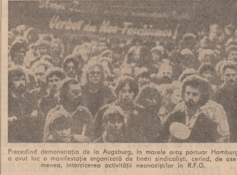
Precedînd demonstrația de la Augsburg, în marele oraș portuar Hamburg a avut loc o manifestație organizată de tinerii sindicaliști, cerînd, de asemenea, interzicerea activității neonazistilor în R.F.G.