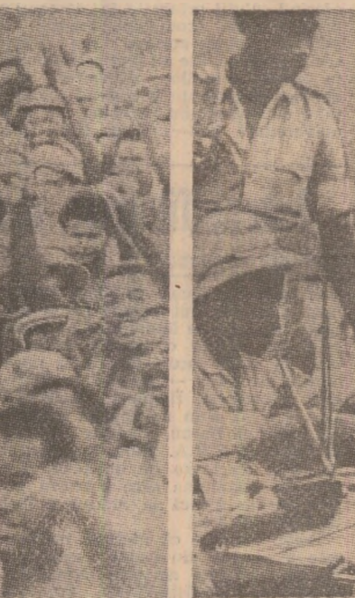
În timp ce autoritățile rasiste de la Pretoria încearcă să-și permanentizeze ocupația asupra Namibiei, instalând aici o administrație marionetă, poporul namibian cere tot mai insistent organizarea de alegeri democratice...