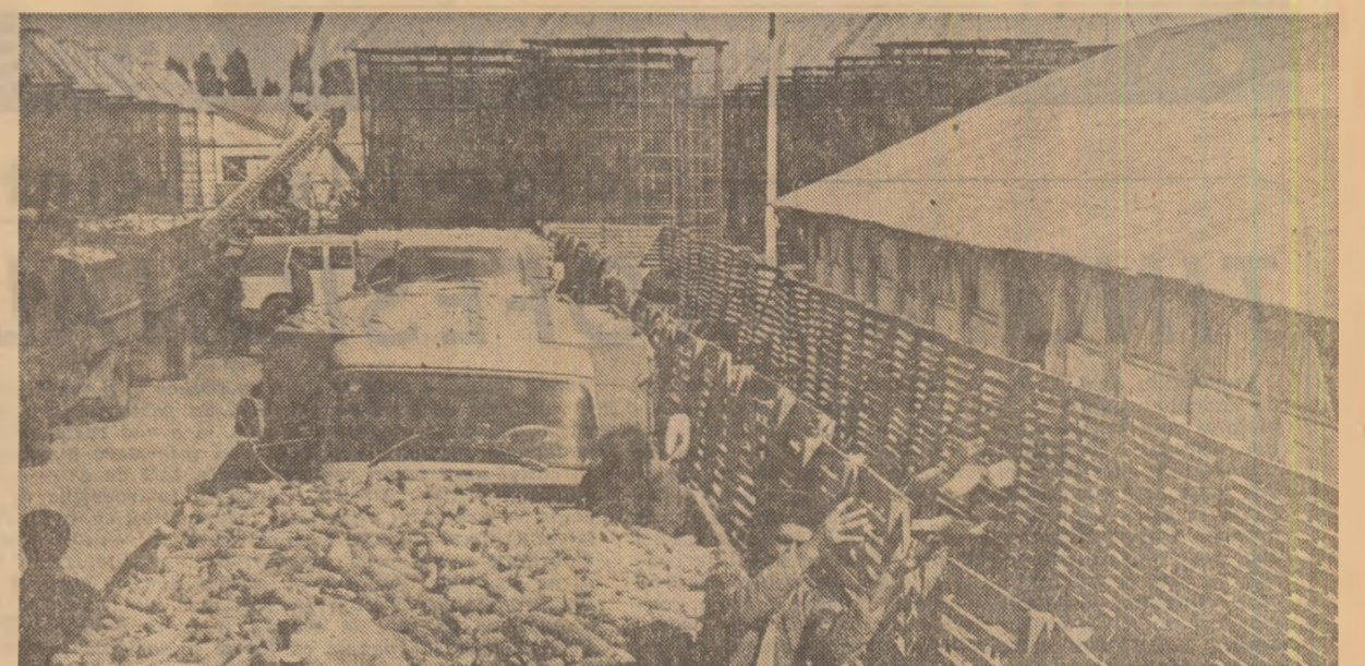
Între o imagine ce poate fi întâlnită frecvent la bazele de recepție a cerealelor din județul Mureș: multe cooperative agricole au hotărât să livreze suplimentar fondul de stat importante cantități de porumb.