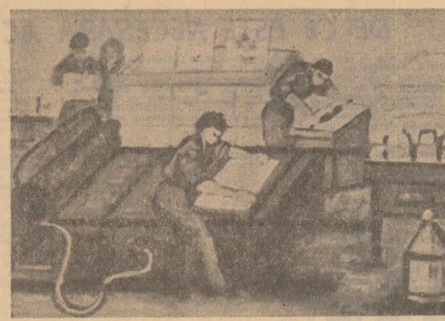
Constanța Stamate, Combinatul poligrafic „Casa Scintei”