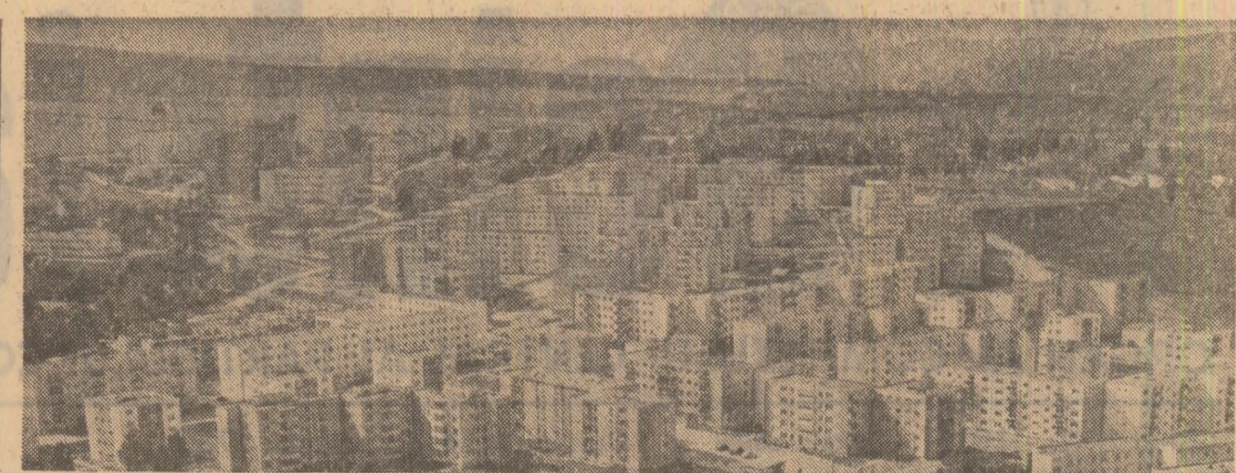
Modernul cartier de locuințe „Simion Bărnuțiu” din Zalău

— Prin acțiunea lor multiplă, fibrele vegetale existente în legume, fructe, cereale, au un rol însemnat în prevenirea unor boli, în special, între care cancerul, ca și în ameliorarea unor tulburări metabolice, cum ar fi cele din diabet, obezitate, dislipidemie etc. S-a observat, de asemenea, că există un paralelism între regimurile bogate în „fibre”, scăderea colesterolului și scăderea frecvenței mortalității prin infarct miocardic și a cancerului de colon. Unele cercetări au arătat că frecvența cancerului de colon în diferite țări este legată de creșterea grăsimilor în alimentație. În funcție de cantitatea de grăsimi se dezvoltă și microflora intestinală, care acționează asupra substratului formînd substanțe cancerigene: așa se explică frecvența cancerului de colon în paralel cu creșterea consumului de grăsimi alimentare și reducerea în același timp a cantității de fibre alimentare, mai ales a celor de origine cereale. Creșterea consumului de carne, grăsimi, dulcitură concentrează și în sine poate crea un dezechilibru de urme de tulburări la diferite niveluri ale organismului. Or, toate acestea pot fi prevenite prin o alimentație cumpunată și echilibrată în ceea ce privește conținutul de legume, fructe proaspete și cereale, care de altfel nu trebuie să lipsească din alimentația zilnică.