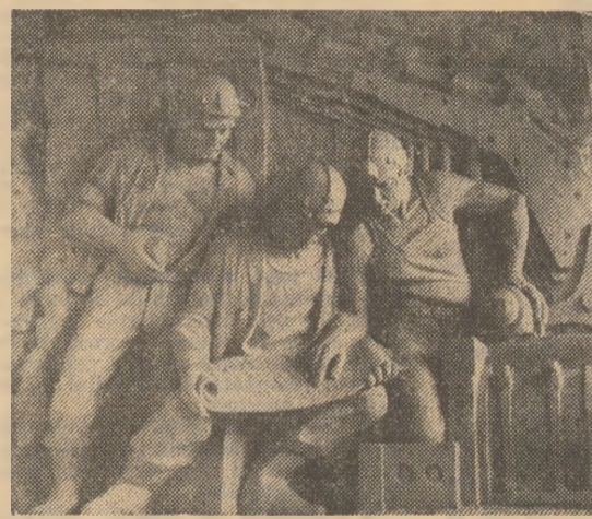
Detaliu din basorelieful „Evoluția minerului”