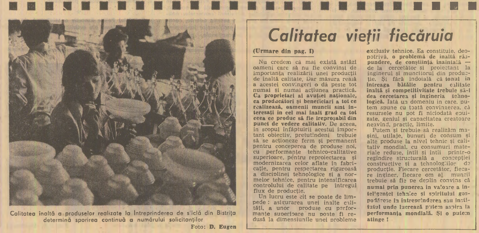
Calitatea înaltă a produselor realizate la Întreprinderea de șicilor din Bistrița determină sporierea continuă a numărului solicitanților.

Concluziile unui schimb de experiență privind activitatea punctelor de documentare politico-ideologică Concluziile unui schimb de experiență privind activitatea punctelor de documentare politico-ideologică