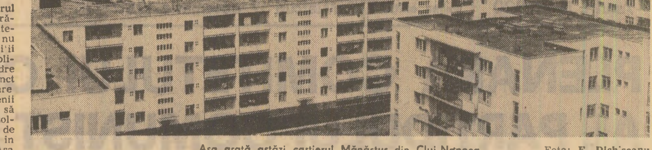
Așa arată estăzi cartierul Mănuștur din Cluj-Napoca.

s-a născut ideea colectivelor de lucru. Structura concretă și amănunțile privind modul de funcționare a acestor colective ne-au fost expuse de tovarășul Iosif Jude, secretarul comitetului executiv al consiliului popular municipal: — Au fost organizate pe criteriu teritorial 33 de colective de lucru — pentru circumscriptiile județene și municipale, în fiecare din aceste colective — care și desfășoară activitatea sub conducerea deputaților respectivi — activează un delegat al comitetului executiv al consiliului popular municipal și un reprezentant al P.D.U.S. Acestor factori de largă autoritate li se adaugă cei cu competența tehnică și materială necesară rezolvării problemelor din circumscriptii — un delegat din partea Grupului întreprinderilor de gospodărie comunală și locală, un delegat din partea Administrației parcurilor și străzilor s.a. Privatizării „Regulamentului”, această structură putea să rezolve realmente operativ o problemă de salubritate, de sistemizare sau de organizare a rețelei comerciale? Deputatul putea să înregistreze problema și