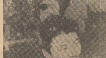
Sub presiunea puternică a opiniei publice, autoritățile din Coreea de Sud au fost nevoite să dispună eliberarea poetului Kim Chi Ho...

DUBLAREA CAPACITĂȚII DE TRANZIT A CANALULUI SUEZ. În prezența președintelui Egiptului, Anwar El Sadat, la Port Said a avut loc o manifestare care a marcat terminarea lucrărilor de adâncire și lărgire a Canalului Suez.