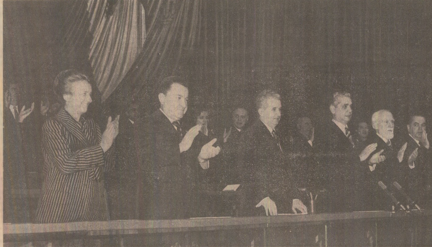
Președintele Republicii Socialiste România, tovarășul Nicolae Ceaușescu, a primit luni pe Ghulam Ishaq Khan, ministrul finanțelor și coordonării al Republicii Islamice Pakistan, care participă, în fruntea unei delegații, la lucrările celui de-a VII-a sesiuni a Comisiei mixte guvernamentale româno-pakistaneze de cooperare economică și tehnico-științifică ce se desfășoară la București.

În cursul cîminalului trecut au continuat să se dezvolte puternic învățămîntul, știința și cultura, au fost luate importante măsuri pentru dezvoltarea și perfecționarea ocrotirii sănătății, s-a lărgit baza tehnico-materială a activității de turism, de odihnă și tratament balnear. A fost perfecționată aplicarea principiilor socialiste de retribuție în raport cu cantitatea și calitatea muncii depuse, s-a introdus principiul participării nemijlocite a muncitorilor la beneficiile întreprinderilor sau unităților în care își desfășoară activitatea, s-a asigurat un raport echitabil de 1 la 5,5 între veniturile mari și cele mici, acțiunile se ferm pentru înfăptuirea în viață a principiilor etice și echității socialiste.