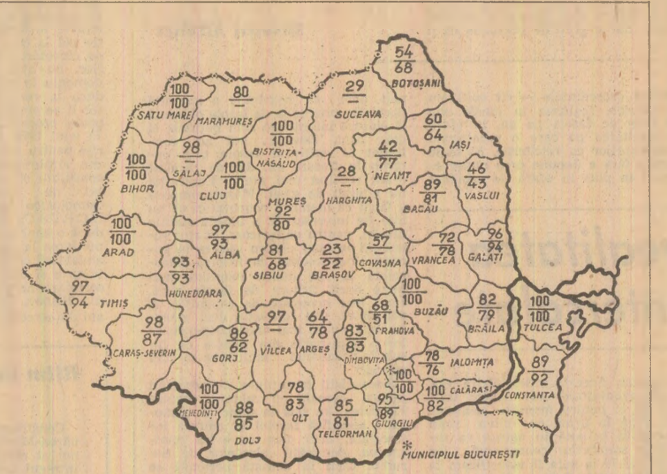
Cifrele înscrise pe hartă reprezintă, în procente față de plan, suprafețele însămîntate cu porumb în cooperativate agricole (cîmp de sus) și în întreprinderile agricole de stat (cîmp de jos) pînă în seara zilei de 23 aprilie (ieri județele Alba, Bacău, Constanța, Dolj, Galați, Hunedoara, Mureș, Sălaj și Timiș au încheiat semănatul acestei culturi).

Despre terminarea însămîntării porumbului în alte județe, precum și despre activitatea desfășurată ieri pe ogoare — relatări în pagina a II-a.