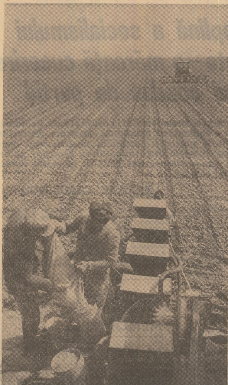
CE FRUMOS ÎI STĂ PĂMINTULUI LUCRAT BINE! O imagine ce vorbește de sine despre calitatea lucrării de însemnare a porumbului la I.A.S. Ograda, județul Ialomița.