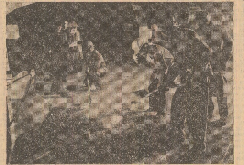
O nouă șarjă la cea mai tinărată cetate de oțel a țării — Călărași

Cu ani mulți în urmă, o mare ocaziune roșie ale Dobrogei și treceam Dunărea spre Călărași. Lumii din oțelul cursă cu zburător, dar marea bucurie era să găsim o barcă bine călăuzită și alitător mironind a castran incens, să mi se legenească todeauna tubură, să aștept cu răbdare intrarea în fermecătorul braț al Borcel, cu ostrovul plin de mistere, cu sălci urtase crescute parcă în inecutul lumii. Într-o asemenea imagine de vesnicie netulburată nu era de mirare că instalările străvechi ale portului și zidurile ridicare pe