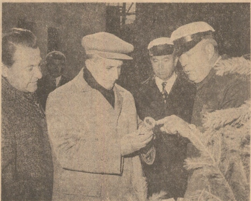
21 octombrie 1976. Tovarășul Nicolae Ceaușescu — primit cu căldură, cu dragoste, ca pretutindeni pe cuprinsul țării, la Baia de Arieș