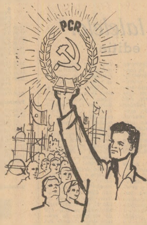
Desen de Gh. CALĂRAȘU

...Modest în începutul, nici nu putea fi altfel, modernă-i astăzi nava, puternică se-arată, iar zestre României și visele de mîine sint altele, liresce, deci au fost odată i Viteaz e comandantul și unică-i voință: în Comunism să-și scrie poporul biruința!