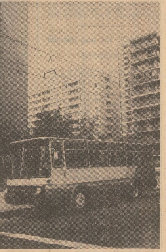
În curînd, pe trasee interurbane: NOI TIPURI DE AUTOBUZE ROMĂNEȘTI

În cinstea zilei de 1 Mai și a aniversării partidului, întrecerea minierilor de la Exploatarea minieră Ilba, din județul Maramureș, s-a soldat cu un însemnat succes în realizarea sarcinilor de plan și angajamentului asumat: îndeplinirea de pe acum a planului pe luna aprilie. Aceasta înseamnă o producție suplimentară de peste 20.000 tone minereu scos la lumină până la finele acestei luni. Tot peste sarcinile acestei perioade s-au efectuat lucrări de deschidere în adâncime a zăcămintului — galerii și așchii — în lungime de circa 2.500 m. iar efortul de diminuare a consumurilor materiale normale a avut ca rezultat economii suplimentare de aproape 1,6 milioane lei. (Gh. Susa).