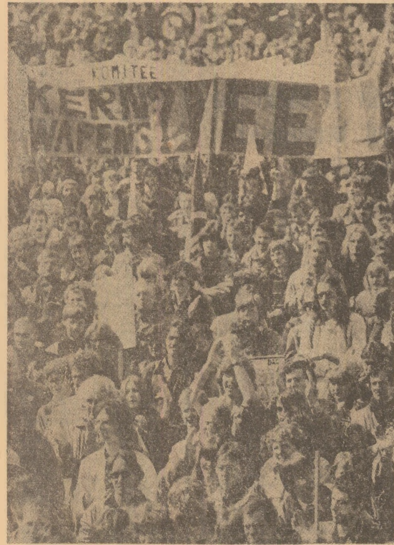
Mii de cetățeni, veniți din diverse țări ale Europei occidentale, au organizat un marș la Bruxelles, în fața sediului N.A.T.O., protestind împotriva proiectelor de amplasare a noi arme și rachete nucleare. În fotografie, grupul de demonstrații din Olanda purtând pancartă cu inscripția „Nu, armelor nucleare!”

În marea sală a Centrului de dirijare a zborurilor cosmice, răsună aplauze puternice. Specialiștii se felicită pentru această nouă și foarte importantă reușită a oame-nilor de știință și cosmonauților, între care se află și un cetățean al Republicii Socialiste România.