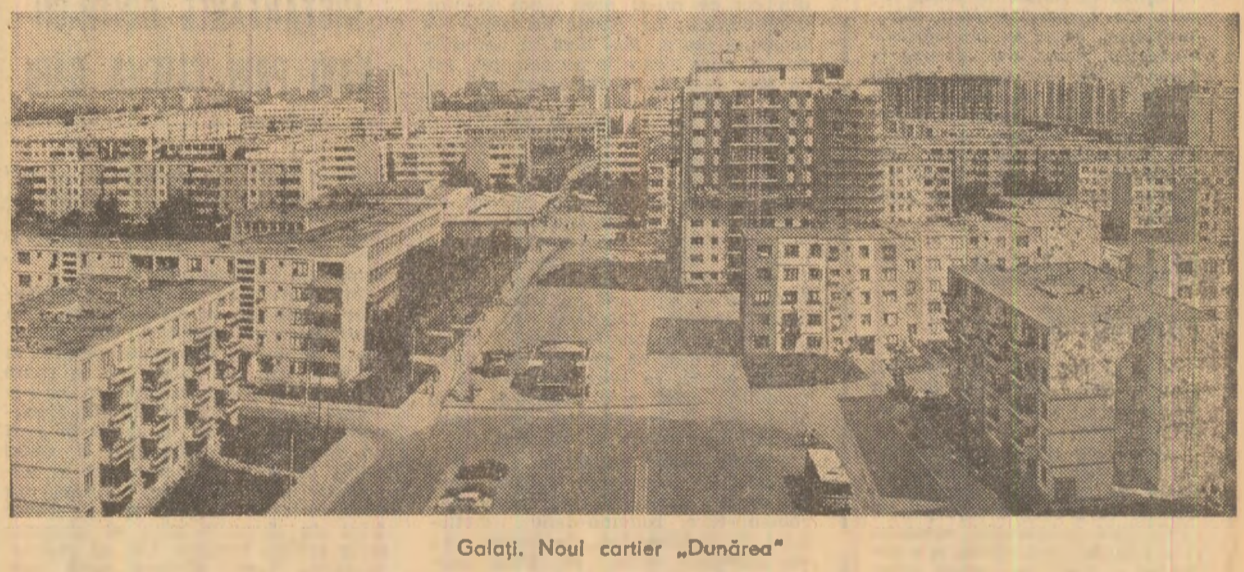
Golați, Noul cartier „Dunărea”

În condițiile climatice din această primăvară, o atenție deosebită trebuie acordată executării fără întârziere a lucrărilor de întreținere la