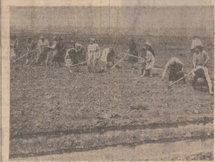
Plantarea tomatelor pe ultimele 5 hectare, la C.A.P. Rovine, județul Ialomița